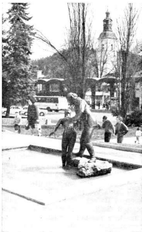
Pogled na del avtobusne postaje v Škofji Loki s cerkvijo sv. Jakoba v ozadju in s plastiko »Jurij in Agata« akad. kiparja Toneta Logondra v ospredju

Po starosti je popis razdelil prebivalstvo takole: otrok do 4 let starosti je bilo v mestu 434 ali 8,8 %, mladine od 5 do 14 let 832 ali 16,8 %, od 15 do 24 let 914 ali 18,4 %, ljudi v zreli dobi od 25 do 49 let 1921 ali 38,7 %, starih od 50 do 59 let 347 ali 7 %, od 60 do 69 let 329 ali 6,6 %, nad 70 let pa 182 ali 3,7 %. Za KS Škofja Loka navajam za iste starostne stopnje le procente: 9,3, 16,7, 17,4, 38,4, 7,0, 7,1, in 4,1. Za vso občino pa 9,4, 17,6, 16,4, 34,3, 7,5, 8,8 in 6. Delež otrok in starih ljudi je torej v mestu manjši kot v KS Škofja Loka in občini, delež zrele mladine in odraslih v najboljših letih pa večji, kar je razumljivo, saj so se v mesto doselili iz vasi predvsem mladi in zreli delovni ljudje.