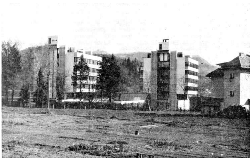
Hrbtni pogled na poslovno zgradbo turistične agencije in na hotel »Transturist«.

V mestu je 1273 ali 91 % takih stanovanj, ki pripadajo samo enemu gospodinjstvu, 7,5 % jih je z dvema, 1,5 % s tremi gospodinjstvi. Udobno naseljenih je 768 ali 54,9 % stanovanj, od teh je 33,2 % takih, kjer pride na stanovalca