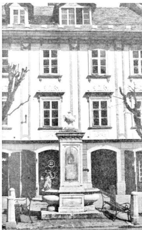
Vodnjak z delom obnovljenega pročelja Kašmanove hiše na Mestnem trgu.

Od prebivalstva, ki ima dohodek od kmetijstva, je v mestu 73 oseb ali 52,1 % aktivnih, 67 oseb ali 47,9 % pa vzdrževanih. Na območju KS Škofja