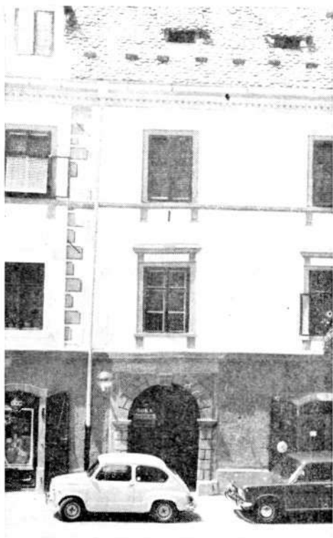
Deli obnovljenega pročelja Kocelitove hiše na Mestnem trgu.