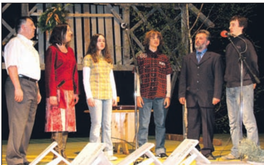
Družina Repenšek iz Mozirja med nastopom