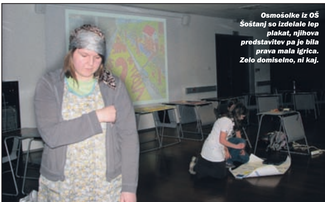
Osmošolke iz OŠ Šoštanj so izdelale lep plakat, njihova predstavitev pa je bila prava mala igrice. Zelo domiselno, ni kaj.

elektrike v TEŠ, tudi plinskih turbinah in načrtovani gradnji bloka 6. Ob tem smo se veliko pogovarjali tudi o tem, kako lahko sami varčujemo z energijo. Da so o tem razmišljali tudi sami, povedo odlični plakati. Nekateri so tako dobri, da bi se lahko njihovi avtorji takoj zaposlili v oglaševalskih agencijah,« je mlade pohvalil Šterbenk.