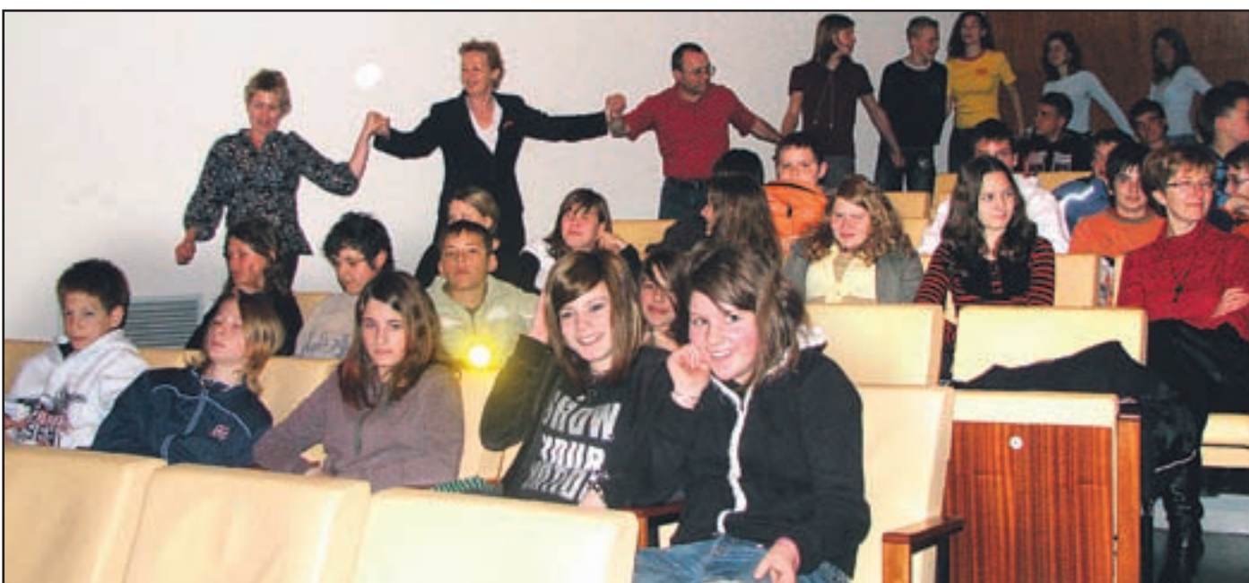
Z mladimi se je zabavala tudi ministrica za zdravje Zofija Mazej Kukovič. V Velenju so bile štiri prireditve, udeležilo pa se jih je blizu 1.000 učencev.