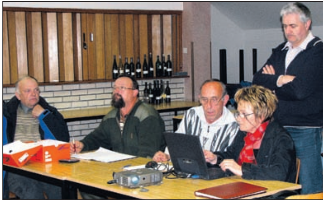
V pričakovanju rezultatov ocenjevanja