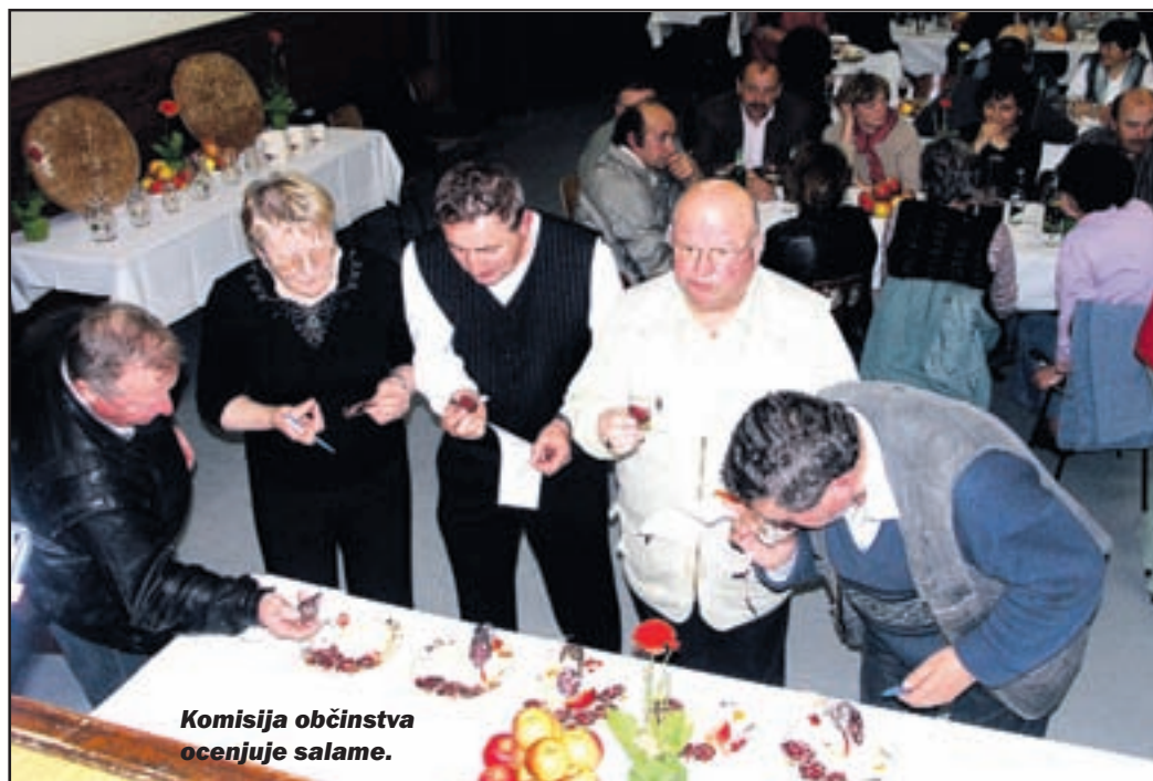
Komisija občinstva ocenjuje salame.