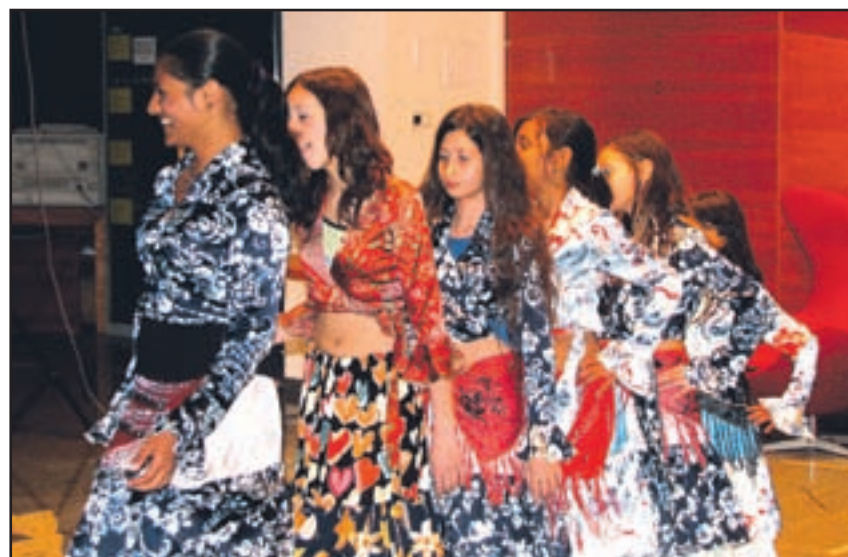
Vo kviruv elenjskegar omskegad ruštva eluje tudip lesnas kupina. Dekletag ojjot ipičen omski ples, pri čemer so izn astopa vn astopb oljše.

bolj ustvarjalni, na kar je ponosen. Povedal pa je, da je bila v Velenju ustanovljena komisija za romska vprašanja, ki trenutno ne deluje, ter da si želi, da se spet aktivira. Ob tem je povedal, da velenjska