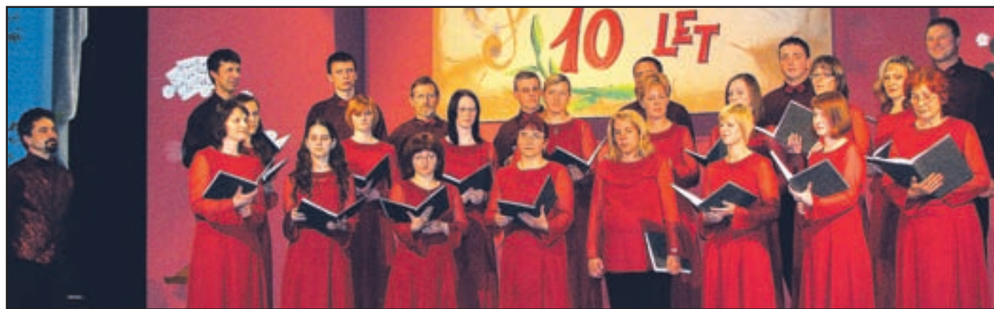
Vs vojev rstev abijol jubiteljep etja tudi izd rugihk rajevš alešked oline inn jeneo kolice.

jo peti, je kar nekaj časa tlela želja po ustanovitvi mešanega pevskega zbora. Navsezadnje to ni bilo nič čudnega, saj je ta nekoč v Šmartnem ob Paki že deloval,« je pojas-