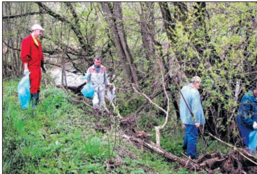
Utrinek s čiščenja nabrežin reke Pake