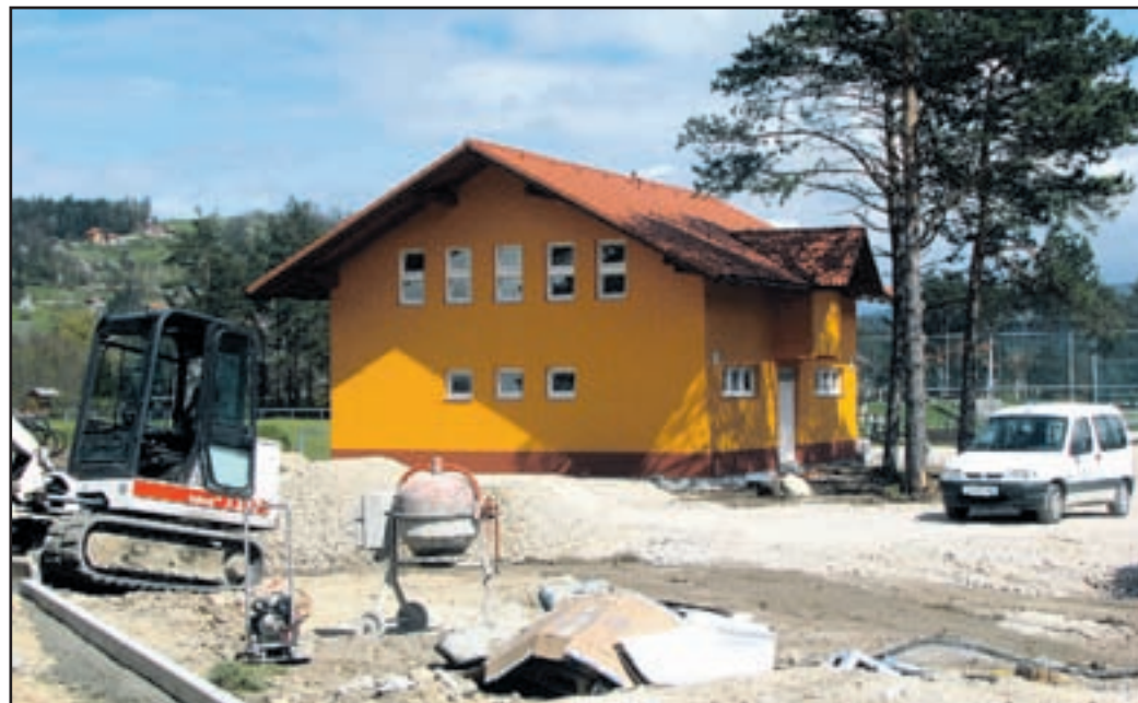
Športni park v Lokah obiva vse bolj rejenop odobo.

sko dolino. Za to imajo imenitne možnosti. Do sredine letošnjega septembra naj bi končali predvidena dela pri ureditvi trškega jedra. Prva faza je že končana, v polnem zamahu so dela druge faze. »Ob tej priložnosti prosim tržane in tudi druge udeležence za strpnost. Pri tem naj jim bo v ospredju cilj