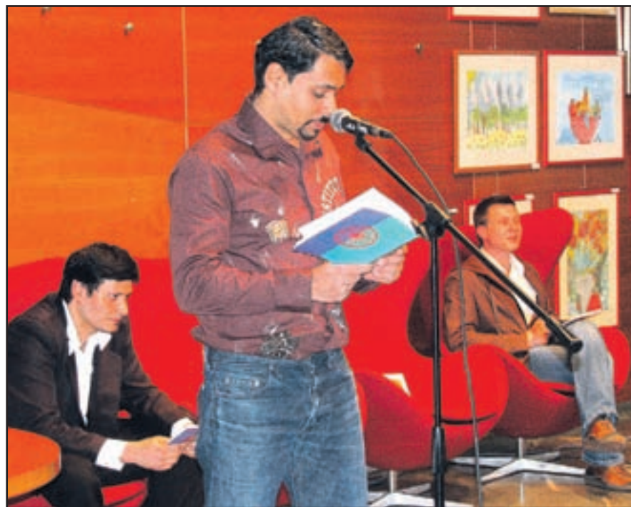
Večer, ki je bil posvečen svetovnemu dnevu Romov, je bogatil z animiranimi, neposredno romskimi literarnimi deli. V romskem jeziku.

V četrtek zvečer so člani društva Romano Vozo - v njem trenutno deluje 40 članov - skupaj s člani Šaleškega literarnega društva Hotenja pripravili literarni večer, ki je bil posvečen svetovnemu dnevu Romov. »Svetovni dan Romov