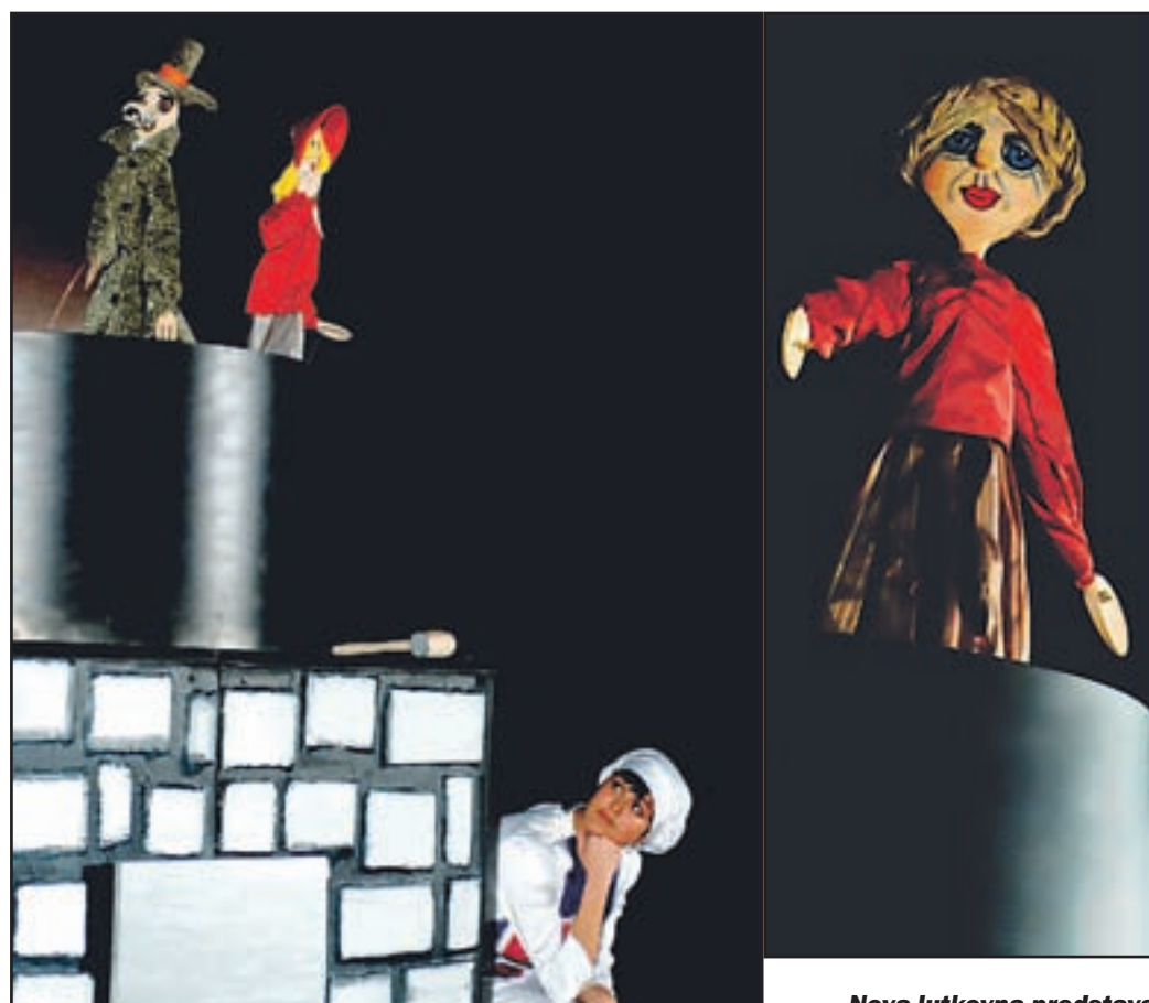
Nova lutkovna predstava velenjskega Lutkovnega gledališča bo zagotovo doživela veliko ponovitev. Navdušila je že na premieri.

In zakaj v naslovu pravljice ravno kuhanje? Zato ker se v predstavi kuha, tako in drugače. Glavna scena je velik kuhalni lonec, pa tudi zato, ker so lutke - javajke izdelane iz malih in velikih kuhalnic. Kako pa se zgodba zakuha in začni, pa se izplača izvedeti na sami predstavi, ki jo bodo malčki v prihodnjih mesecih lahko obiskali. Predstava zgodbo o Rdeči kapici ne popači, a vendar obrne tako, da je zanimiva tudi za starše ter ded-