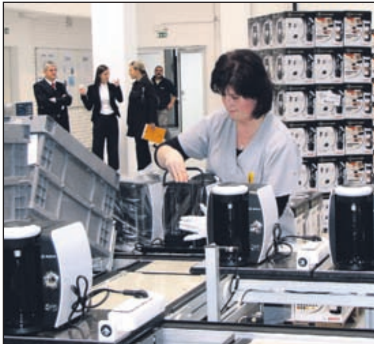
V novih proizvodnih prostorih žep riblično mesec dni estavljajo tehnološkon ajnaprednejšea parate zap ripravn apitkov Tassimo.

Andreas Liebl je ob tem predstavil še rezultate prizadevanj pri varovanju okolja in energetske učinkovitosti njihovih izdelkov. Za ogrevanje uporabljajo 50 odstotkov modre energije, za izredno umno potezo se je pokazala zamenjava toplotnih regula-