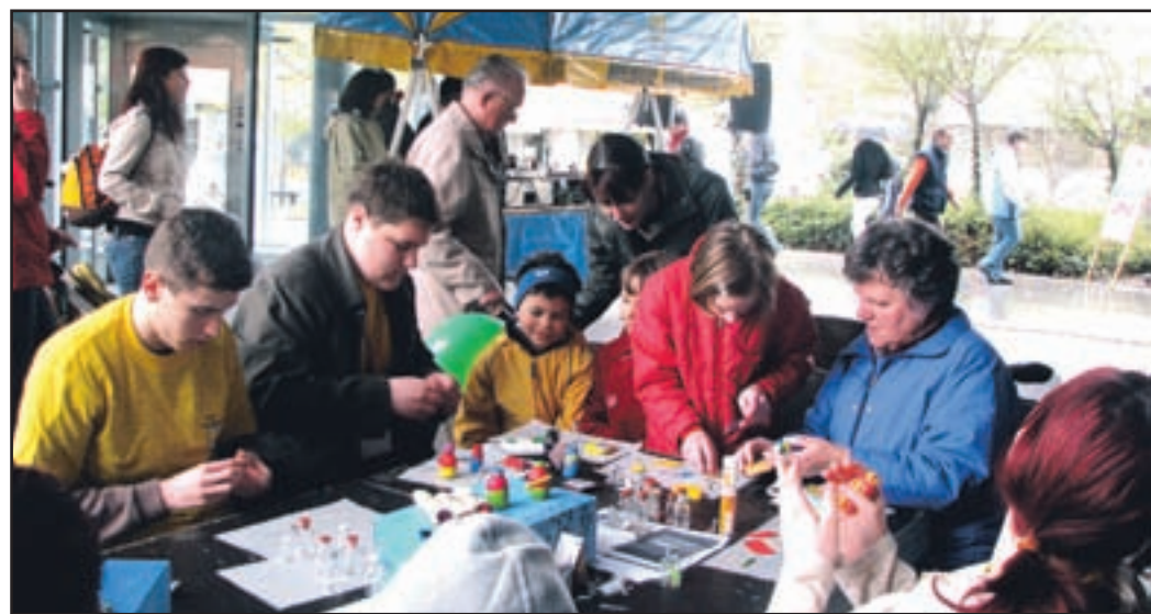
Čeprav je festival prostovoljstva zaradi močnega dežja potekal pod napuščem Nove, je bil prava popestritev sobotnega dopoldneva v mestu. Ljudje so se ustavljali, ustvarjali stekleničke upanja, uživali v gledališki predstavi, petju ...

Naslednja številka Našega časa izide 8. maja!