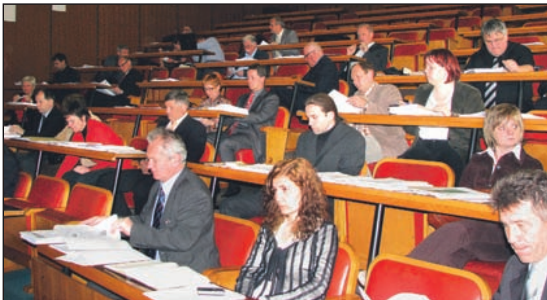
Svetniki so menili, da bi bilo treba omejiti hitrost na kar nekaj mestnih cestah, kjer so pešci ob povečanem prometu še posebej ogroženi.