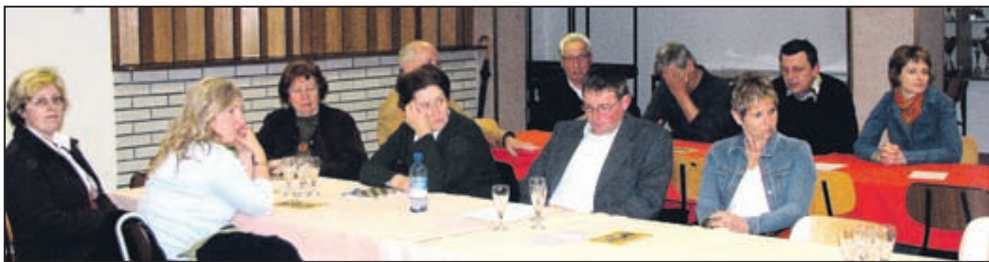
Tudi lani so organizirali nekaj odmevnih prireditev.

V letošnjem delovnem programu šmarških turističnih delavcev so zapisane vse naloge iz lanskega leta, le da bodo letos logistiko za tridnevni izlet z vlakom v Sarajevo konec junija prepustili velenjskemu turistično-informativnemu centru, z muzejskim vlakom pa bodo popeljali udeležence v Kamnik. Pripravili naj bi še kakšen kuharski tečaj več v Martinovi vasi, saj se je pokazala doobra oblika druženja s koristnim, obnovili pa naj bi še svojo brunarico v Martinovi vasi. »Še marsikaj bi izpeljali, če bi bilo več ljudi pripravljenih delati, nenazadnje pa tudi kanček več dobre volje.«