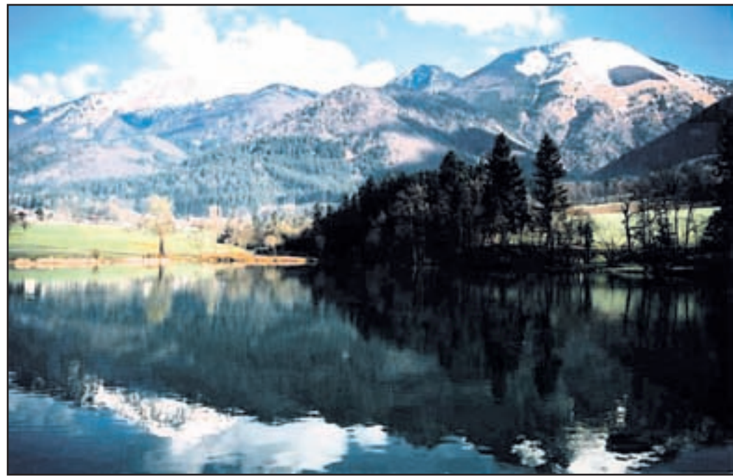
Romantika že na začetku poti ob jezeru Črnava v Preddvoru

darle smo se poslovili, saj bomo semkaj še prišli. Korak se je usmeril proti Potoški gori, ki nas je nagradila s čudovitimi razgledi in »babjim pšenom«, da nas je razgrete malo ohladil. Prav veseli smo ga