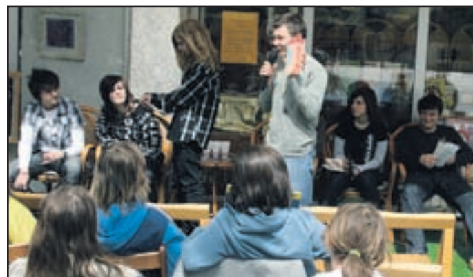
Dnevi slovenske knjige so se začeli z branjem poezije velenjskih osnovnošolcev. Do včeraj se je v Kulturnici zgodilo še veliko zanimivih dogodkov, povezanih s knjigo.