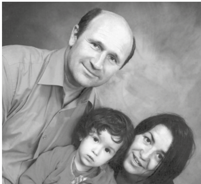
Naročnik: Slovenska ljudska stranka