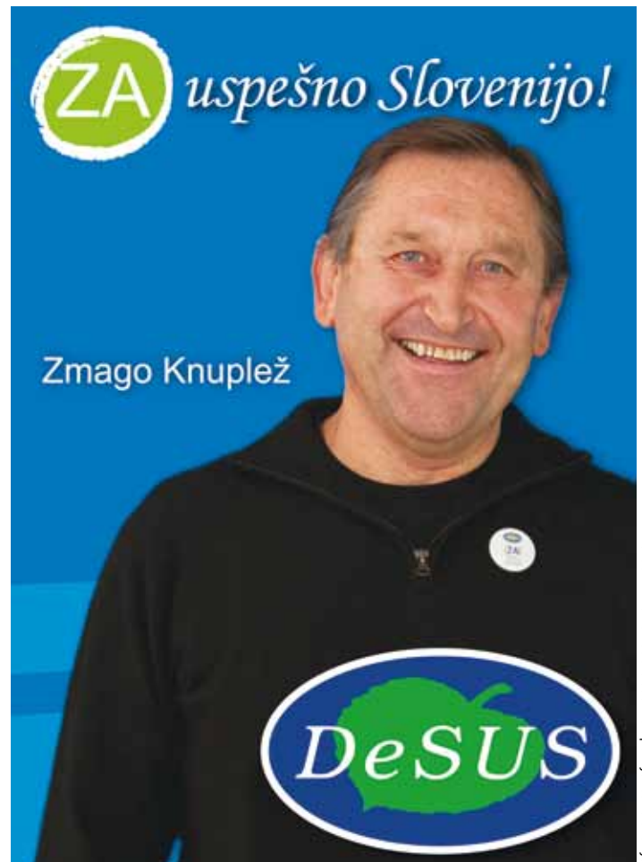
Narčnik: Demokratična stranka upokojencev Slovenije