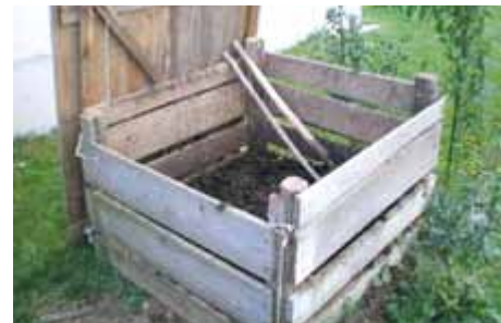
Primer ustreznega kompostnika (obvezno mora imeti pokrov, ki mora biti, razen ob polnjenju ali praznjenju, vedno nameščen)