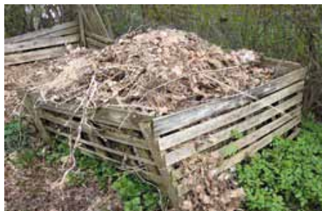
Primer neustreznega kompostnika

JAVNO KOMUNALNO PODJETJE PRODNIK D. O. O.