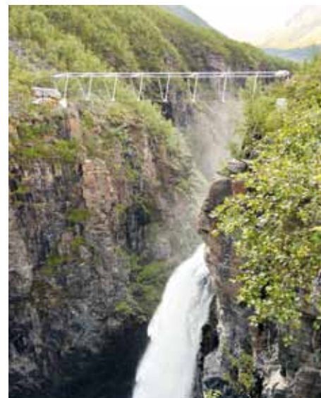
Slap in most v ozadju

Na ta opravljeno delo sem bil in sem še vedno izredno ponosen. Mislim, da v življenju ne bom imel več velikokrat priložnosti delati na tako spektakularnem projektu. Projekt je doživel kar nekaj zanimanja medijev, saj je bil izredno zanimiv in pomeni veliko injekci-