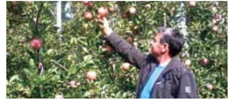
Sadovnjak pri Rosovih

V dolini Črnega grabna ponudbe jabolk ne manjka. S prodajo se trenutno ukvarjajo trije večji pridelovalci sadja.