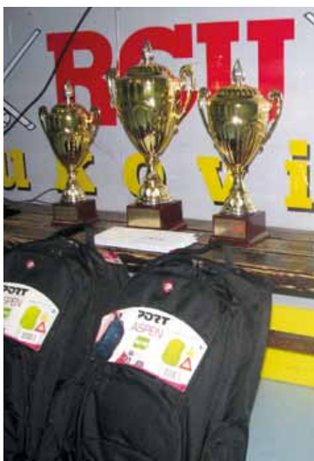
KDO BO PRVAK SEZONE 2011/2012?