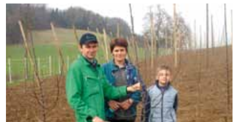
Kašnikovi v sadovnjaku