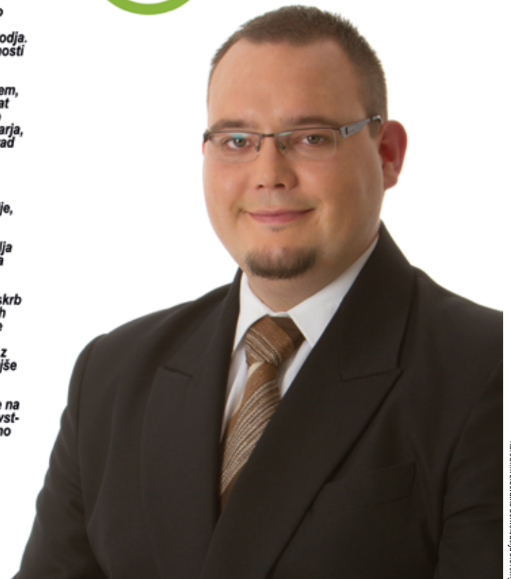
Narodnik: Liberalna demokracija Slovenije