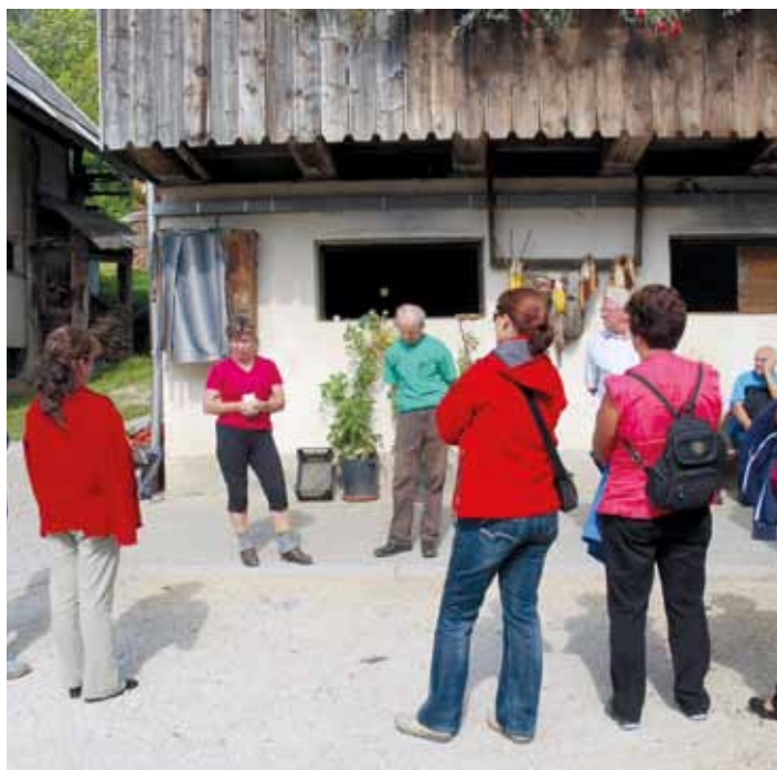
Na kmetiji pri Šimnovc na Plavškem Rovtu

Pred ogledom zadnje kmetije smo se ustavili še v lani odprtem Planin-