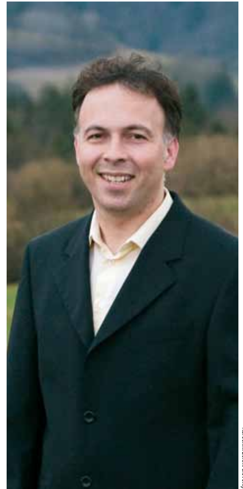
Narodnik: Zeleni Slovenije