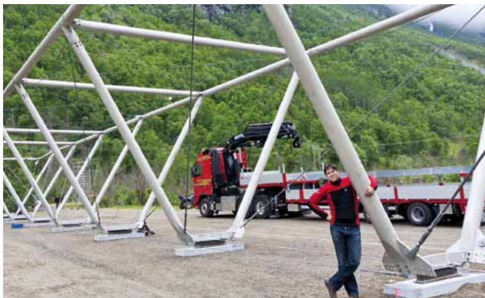
Jure ob svojem mostu

Na Norveško sem odšel v okviru mednarodne študentske izmenjave Erasmus. Našel sem si delo v manjšem biroju za statične analize. Tja sem poslal prošnjo predvsem zato, ker so delali »slavno« holmenkollensko skakalnico v Oslu, ki je res impozantna. Pred prihodom nisem točno vedel, kaj bom počel. Prvi teden sem tako na roke kopal luknje za temelje mostu, za katerega sem kasneje izdelal tudi celoten statični izračun. Poleg tega projekta sem delal tudi na nekaterih drugih velikih projektih, kot je npr. prenova nakupovalnega centra v turistično zelo obiskanem delu mesta. Moje delo je bilo tako izdelava statičnih analiz za veliko zahtevnih objektov.