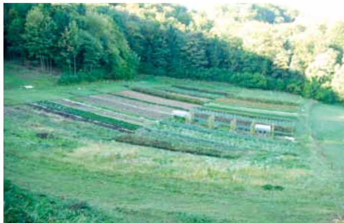
Pridelava zelišč na kmetiji Kalan

skem muzeju v Mojstrani, kjer nas je vodička popeljala po zanimivo zastavljeni razstavi o razvoju planinstva v Sloveniji. Na koncu smo si ogledali tudi film o lepota naše dežele in se ponovno prepričali, da živimo v raji pod Triglavom – samo oči in ušesa moramo odpreti za lepoto, ki nas obdaja.