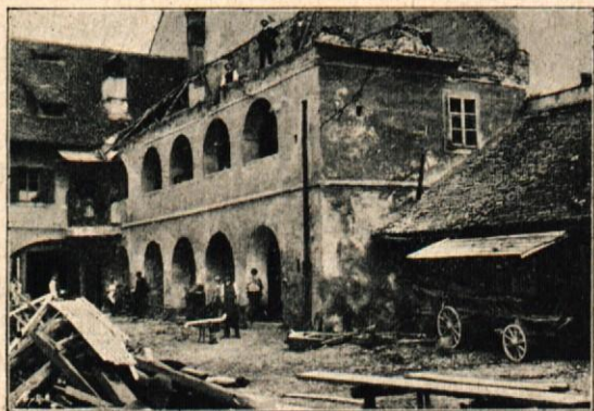
Premkova hiša poleg nunske cerkve.

postavljeni dijaki vseh srednjih šol, učiteljski kandidati in kandidatkinje, učenci strokovnih in mestnih ljudskih šol ter gojenci Marijanišča, vsi pod vodstvom dotičnih učiteljskih zborov. Dijaki velike realke so imeli s soboj šolsko zastavo. Državni učitelji so bili vsi v paradni uniformi. Z vidnim zanimanjem se je cesar oziral po