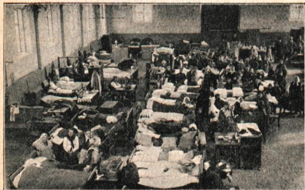
Prenočišče v jahalnici.

Prišedši na Marijin trg si je cesar ogledal po vseh ondotnih hišah in se jako čudil, da visoka Paulinova hiša ni nič poškodovana. Pred cerkvijo je čakal knezoškof dr. Missia z gvardi-