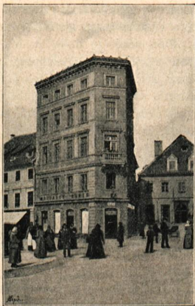
Paulinova hiša na Marijinem trgu.