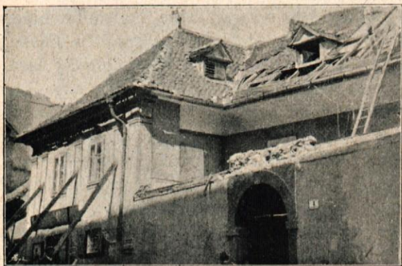
Vilharjevi hiši pri frančiškanski cerkvi.