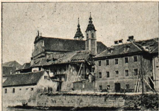
Mayerjeva hiša na sv. Petra cesti.

Točno ob 3. uri je s separatnim dvornim vlakom dospel cesar v Ljubljano. Na peronu, kamor je bil vstop dovoljen le tistim, ki so se