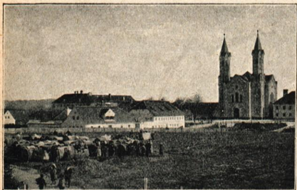
Prenočišča v kadeh pri trnovski cerkvi.

Veličanstvo s spremstvom. „Moja gospôda!“ — dejal je presvitli cesar, obrnen proti občinskemu svêtu, ko je komaj stopil iz voza — „obžaljujem, da je to mesto zadela takšna nesreča, ali Vi lahko trdno upate, da se Vam podelî najizdatnejša