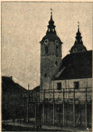
Sv. Jakoba cerkev.

Poslopje deželne vlade, takozvani „lontovž“, je silno razdejan. Sprednji trakt na Turjaškem trgu se bo dal morda še popraviti, seveda le z velikimi troški, zadnji trakt, v Salendrovih ulicah, pa se mora do tal podreti.