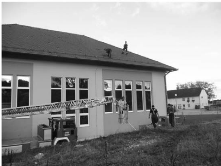
Sanacija strehe na osnovni šoli, vrtcu in telovadnici z avtodvigalom.