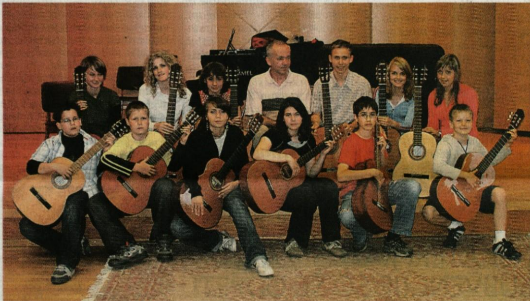
Kitarski orkester Glasbene šole Kamnik.

Zaradi velikega števila nastopajočih se je koncert delil na dva dela. V prvem delu je nastopil tudi orkester Glasbene šole Kamnik, ki deluje na šoli že od leta 1974. Zlata doba orkestra je bila v 80-ih letih. Med najbolj odmevne nastope sodijo večkratni nastopi v Celovcu in Gorici v okviru srečanja treh dežel Slovenije, Koroške in Tržaške pokrajine, nastopi na Onkološkem inštitutu v Ljubljani, vsakoletnem odprtju mednarodnih razstav Ex Libris v Komendi, leta 1982 pa v Cankarjevem do-