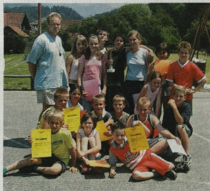
Ekipa PGD Gozd - zmagovalci pokala.

in poskrbeli tudi za nemoten potek turnirja. Kljub izredno slabemu stanju igrišča na Vrhpolju jim je uspelo brezhibno pripraviti kar tri travnata igrišča in gole za mali nogomet. Krajevna skupnost Nevlje in občina Kamnik namreč že nekaj desetletij nista investirali v obnovo oz. popravilo igrišča, ki žalostno propada. Najosnovnejše stvari, kot so nakup novih mrežic za koš oz. mrež za gole, risanje črt in popravilo dotrajane ograje, golov in košev, je prepuščeno določenim mladim posameznikom in njihovim denarnicam. Tudi PGD Nevlje ni vseeno, kaj se godi z domačim igriščem, zato so mladim pomagali financirati in obnoviti ograjo, ki obdaja igrišče. Igrišče na Vrhpolju je stičišče mladih, na njem potekajo razne športne aktivnosti (turnirji, downhill...), družabne aktivnosti (praznovanje prvega maja), uporabljajo ga tako gasilci za pripravo svoje mladine, kot