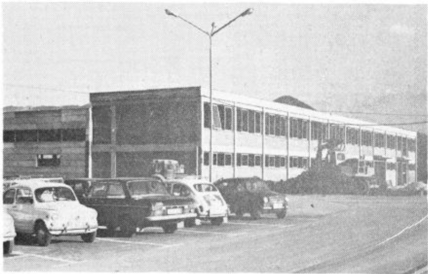
Proizvodna hala rudarskega šolskega centra