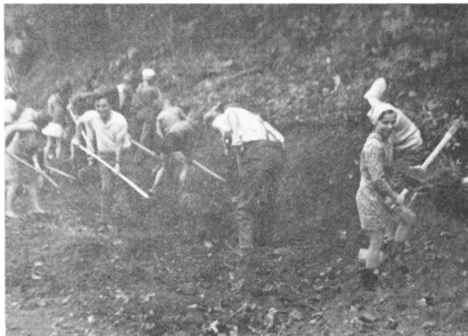
Prostovoljci na delu

Na zadnji konferenci aktiva ZMS Gaberke je predsednik krajevne skupnosti izročil mladim v znak priznanja za njihovo uspešno društveno delo in za sodelovanje v prostovoljnih delovnih akcijah, sicer skromno, toda praktično darilo — novo mizo za namizni tenis. Mladi so bili nad takšno pozornostjo in priznanjem krajevne skupnosti prijetno presenečeni.