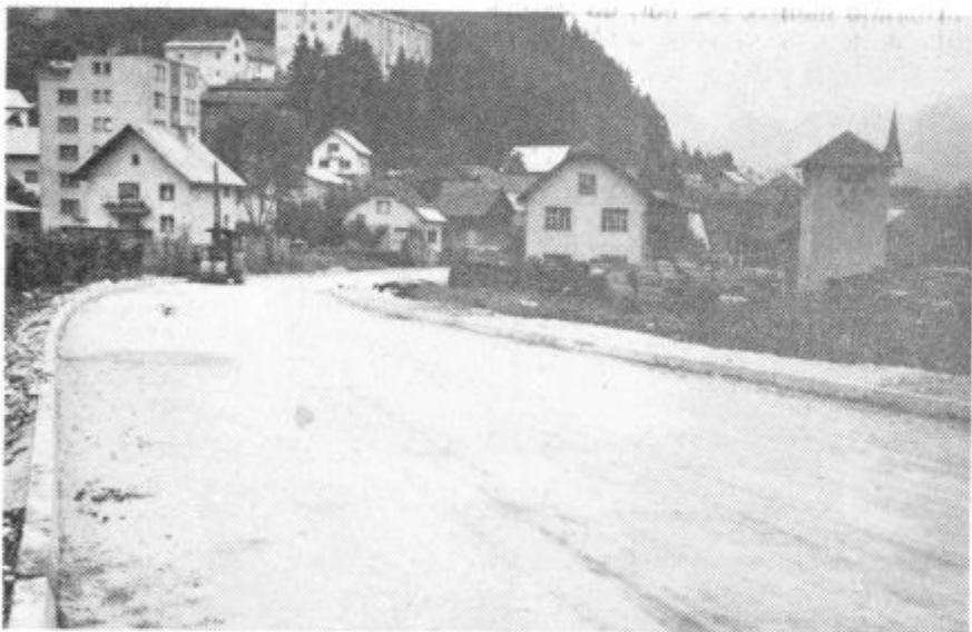
Nova nadomestna cesta

Stanovanjsko podjetje Velenje pa je za tržišče gradilo poslovno-trgovsko stavbo ob Prešernovi cesti. V njej je že prodajalna ljubljanske »Elektrotehne«, v prvem nadstropju bo prodajalna ljubljanske modne konfekcije »Krim«, v drugo nadstropje pa se bo vselil Projektivni biro Velenje.