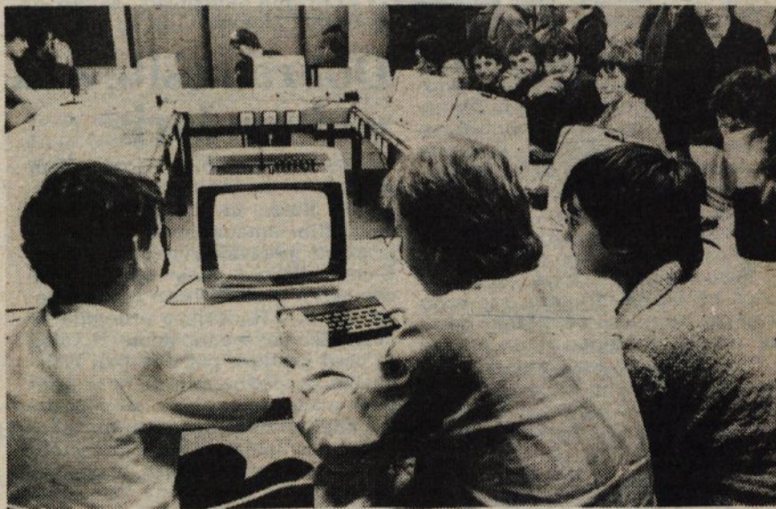
Kranj — Iskra Telematika je podarila kranjskim osnovnim šolam 10 računalnikov za novo računalniško učilnico v celodnevni šoli na Planini. Učilnica bo odprtega tipa, saj je namenjena spoznavanju računalništva vsem osnovnošolcem — kot predmetni pouk ali pa v krožkih.

Iskra Telematika in Iskra Kibernatika imata v kranjskem skladi skupnih rezerv združenih dobrih 68 milijonov dinarjev, zaprosili pa sta tudi že za predčasno pridobitev sredstev kranjskega sklada skupnih rezerv. Problem je v tem, da so temeljne organizacije združenega dela tretjino svojih obveznosti (2 odstotka z zaključnim računom ugotovljenega čistega dohodka) dolžne skladu poravnati v petnajstih dneh, ostali dve tretjini pa v 60 dneh. Sredstva bi se torej v celoti natekla šele do maja. Skupščina sklada je predčasno vnovenčenje odobrila ter dala pobudo o predčasni združitvi sredstev. Pobudo sta že podprla občinski izvršni svet in predsedstvo občinskega sindikalnega sveta. V kranjski občini naj bi torej temeljne organizacije združenega dela sredstva v sklad skupnih rezerv združila že do 25. februarja.