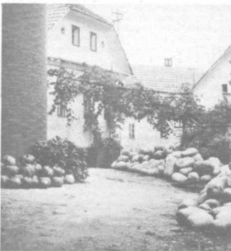
Pomanjkanje vode najbolj prizadene v Vnanjih Goricah kmete, ki imajo svoja gospodarska poslopja predvsem na višje ležečem delu vasi. Nekateri razmišljajo, da bi si napeljali hidroforje in tako omogočili običajno delovanje napajalnikov v hlevih.