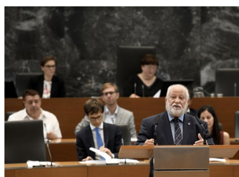
Slika RAFAELOVA DRUŽBA