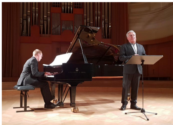
Pesmi mojih domovin