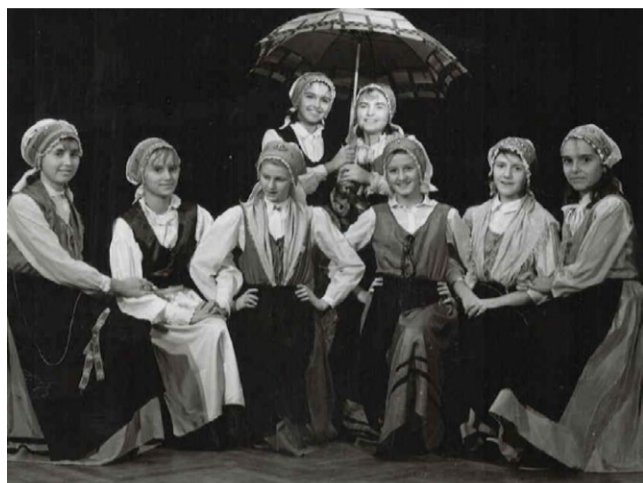
NUK - razstava "Sosedje Slovenci - Slovenci na Hrvaškem"