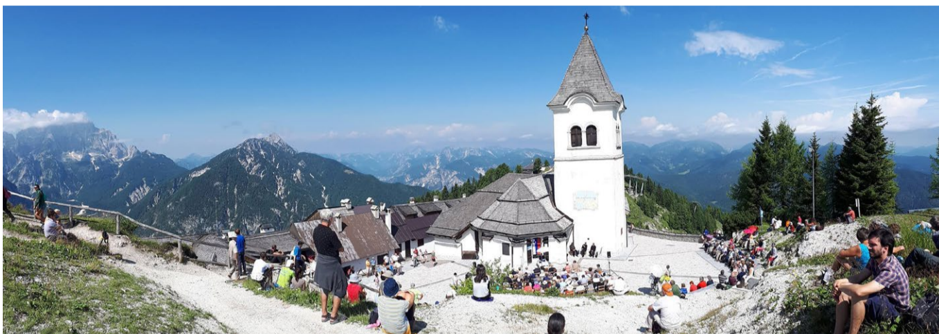
Romanje treh Slovenij