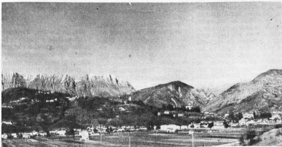
Panorama Tarčenta - bisera Furlanije - z mogočnim Muškim pogorjem v ozadju, ki na dnu zapira Tersko dolino