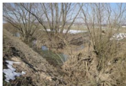
SOJ – Severni obrobni jarek

podpis izjave, da dovolijo izvajalcu uporabo njihovih zemljišč za izvedbo vzdrževalnih del na vodotoku v obsegu nujnih vzdrževalnih del in da lahko upravljalec vodotoka trajno in neovirano uporablja zemljišča ob njem v namene čiščenja struge. Za izvedbo del bodo potrebne podpisane izjave čisto vseh lastnikov,