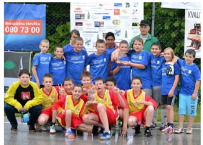
Pionirčki Destrik in Vitomarci