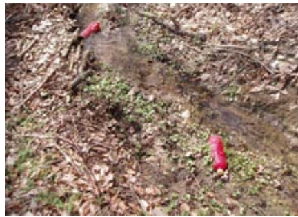
Smeti v naravi