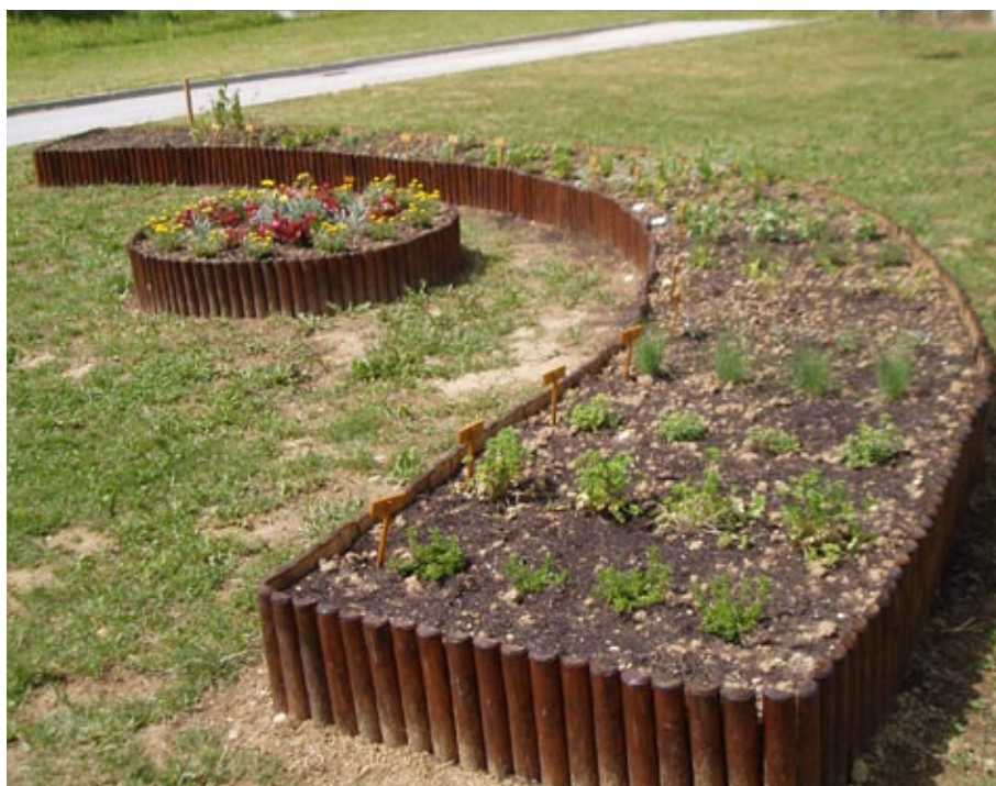
Zeliščni gredici pri POŠ Vitomarci