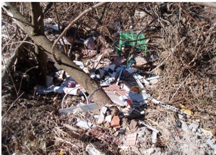
Namesto na deponijo v gozd

Nekateri udeleženi imajo že dobre izkušnje s čiščenjem, saj se akcije udeležijo vsako leto, žalostno pa je spoznanje, da so udeleženi skoraj vedno isti, da se ostali občani ne odločajo za