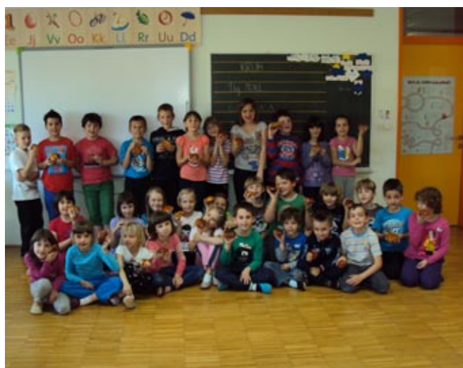
Mmmm, naši dobri kruhki