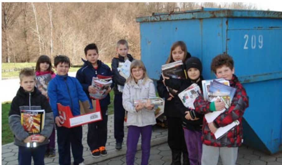
Zbiralna akcija papirja

V okviru osrednjega tematskega sklopa, Zdravje in dobro počutje , smo se posvetili shemi šolskega sadja in sledili cilju, da učenci spoznajo pomen uživanja sadja in zelenjave, predvsem lokalno pridelanih vrst. Enkrat tedensko smo učencem v okviru tega projekta ponudili sadje. Pomen vsakodnevnega uživanja sadja za naše zdravje in dobro počutje so spoznavali tudi v okviru naravoslovnega dne. Povabili smo medicinsko sestro, ki je učencem predstavila pomen zdrave prehrane za naše zdravje nasploh. Našemu vabilu se je odzvala tudi zobna asistentka, ki je učencem in tudi staršem na roditeljskem sestanku podrobneje spregovorila o tem, kako skrbeti za zdravje zob.