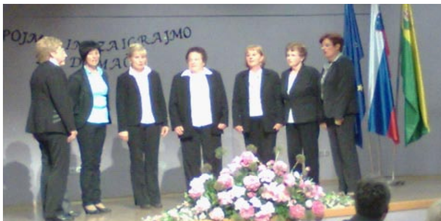
Nastop ljudskih pevk v Destrniku