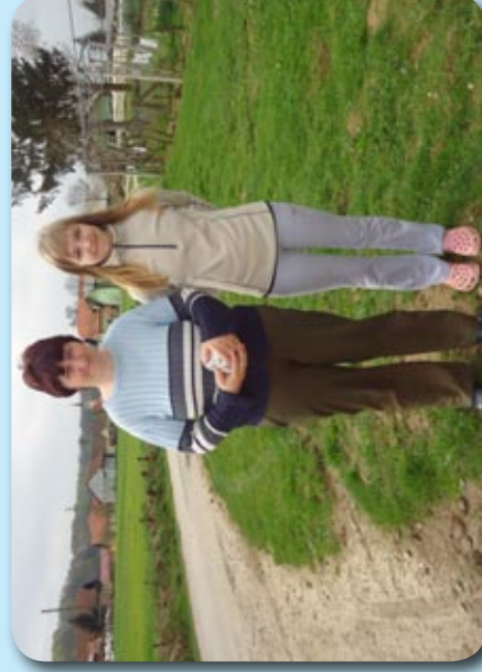
V Hvaletcih le dve udeleženci