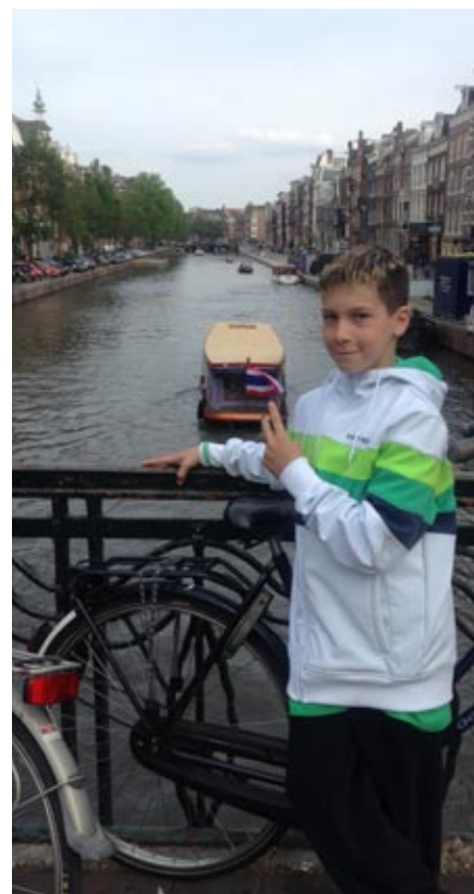
Bor v Amsterdamu