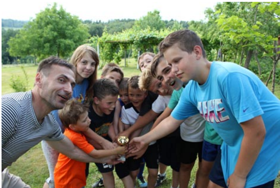
"Hitrejši in boljši" - otroci