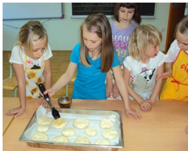
Priprava zeliščnih kruhkov