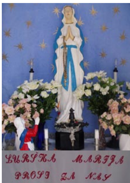
Petričeva kapela (notranjost)

V Zvezi društev upokojencev ZDUS in našem projektne odboru društva starejši za starejše ter sindikatih upokojencev potekajo aktivnosti za boljšo socialno preskrbljenost