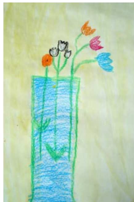
Vaza s cvetjem