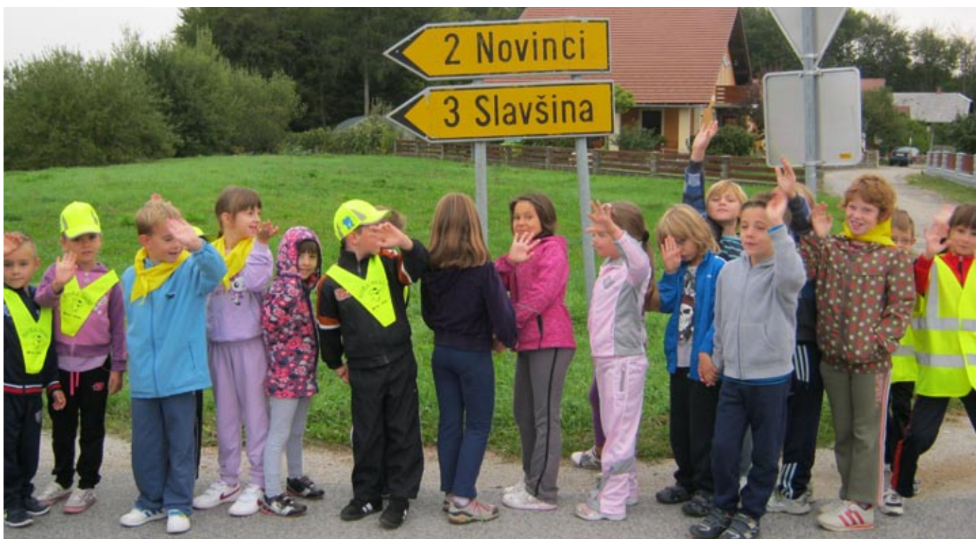
Pot pod noge