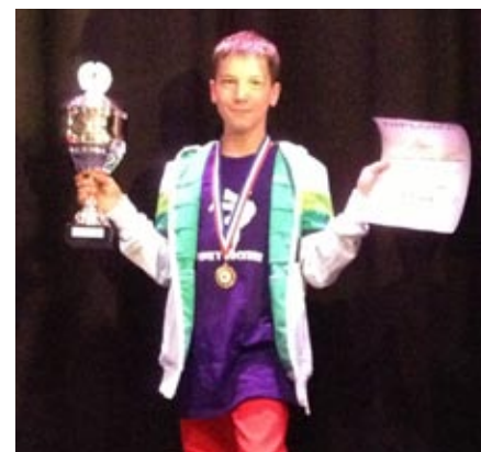
Bor s pokalom in priznanjem