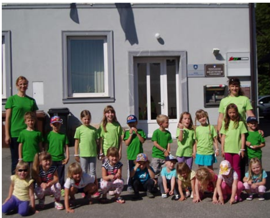
Mini maturantje pred občinsko stavbo

Že čez dobra dva meseca jih čakajo resne zadeve. Želimo jim srečo in obilo uspeha na njihovi novi poti.