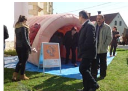
Ogled notranjosti črevesa