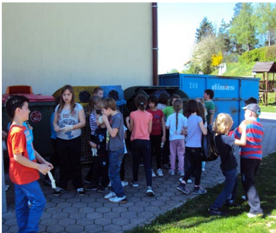
Skrbimo za čisto naravo

Mladi moški ponoči hodijo k ženskam, starejši k hladilnikom.