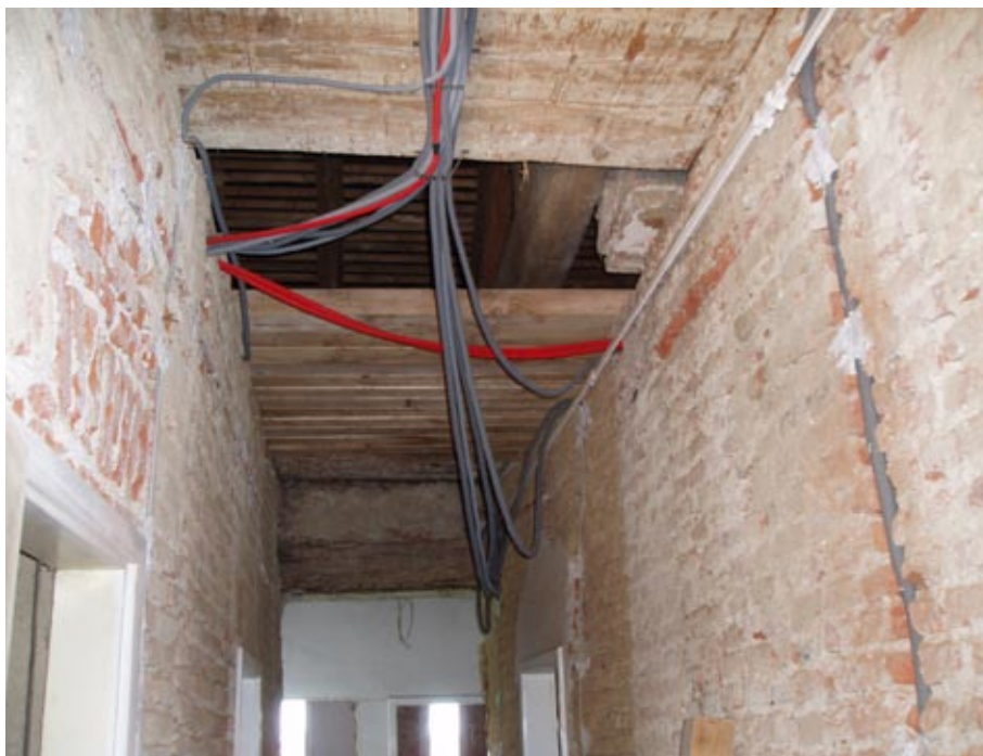
Menjava stropov v župnišču