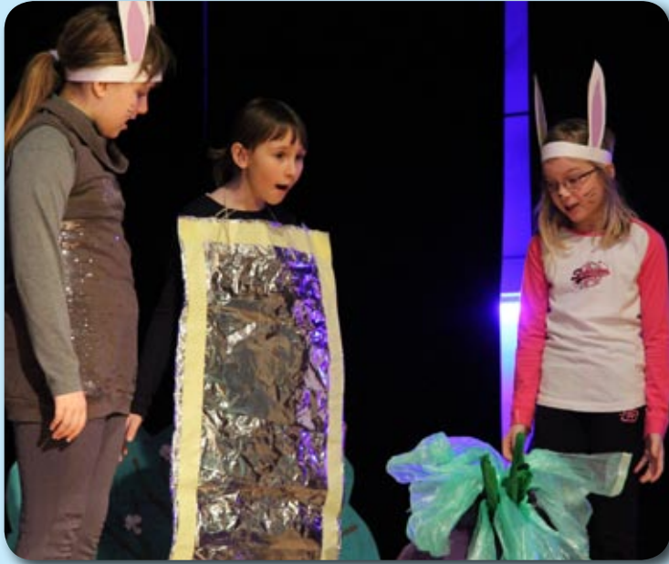
IZ IGRE 'ZRCALCE'