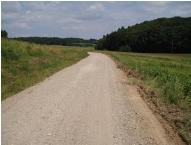
Grediranje ceste Novinci–Župetinci