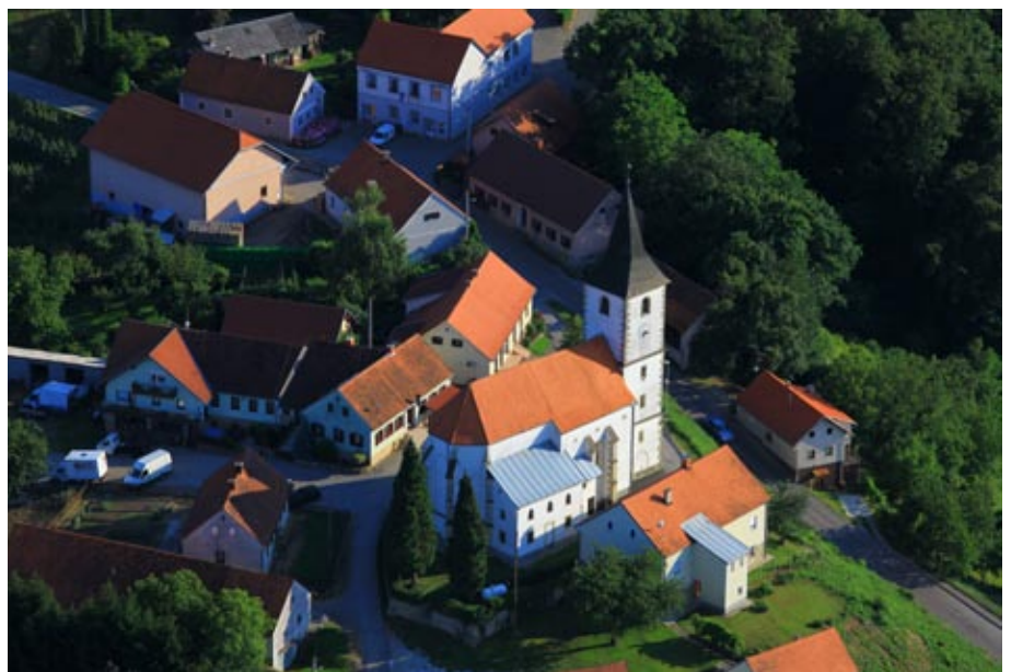
Cerkev in občina iz zraka

pa tudi pod cerkvijo ga je nekaj. Na večih krajih so v zemlji ali okrog trga vkopane obdelane kamnite gmote. Okrog cerkve še obstaja ostanek obrambnega zidu, v samem centru je pozneje stal in še v notranjosti cerkve zmeraj stoji obrambni stolp, ki je v zgodovinpisju omenjen leta 1297. Pri izkopu za spomenik talcev so se odkopali ostanki, podobni dviznemu mostu. Pripoved govori o podzemnem rovu iz cerkve do Toševe ledenice itd.