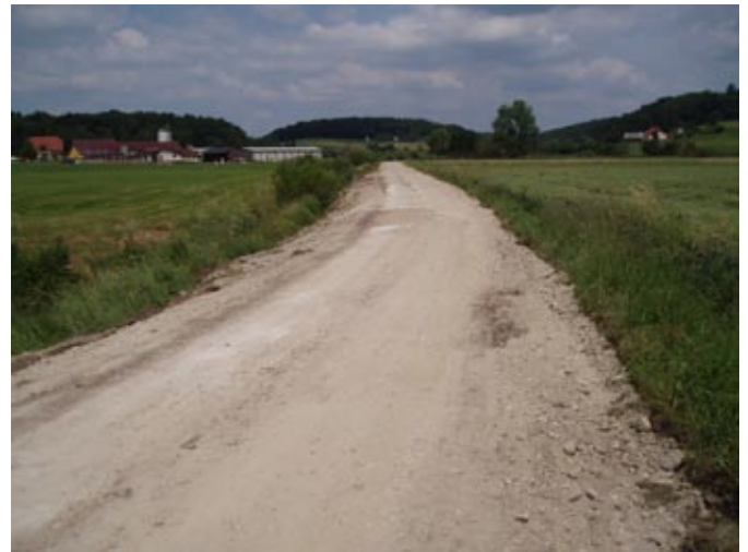
Grediranje ceste Novinci–Hvaletinci