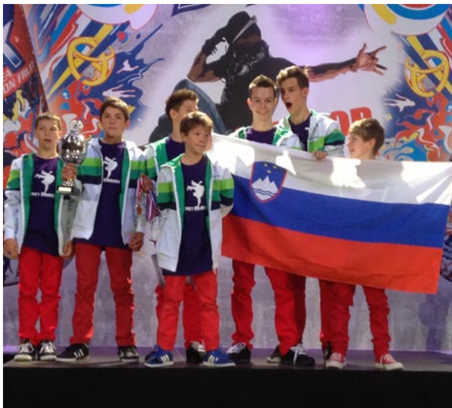
Evropski prvaki s SLOVENSKO zastavo