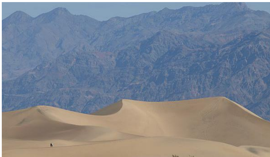
"Dolina smrti" v Severni Ameriki

V ta rekorderja pa se vrine še en kraj, ki je svetovni rekorder, z izmerjeno doslej najvišjo temperaturo