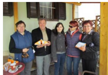
Člani OO RK Sv. Andraž z ambasadorko programa