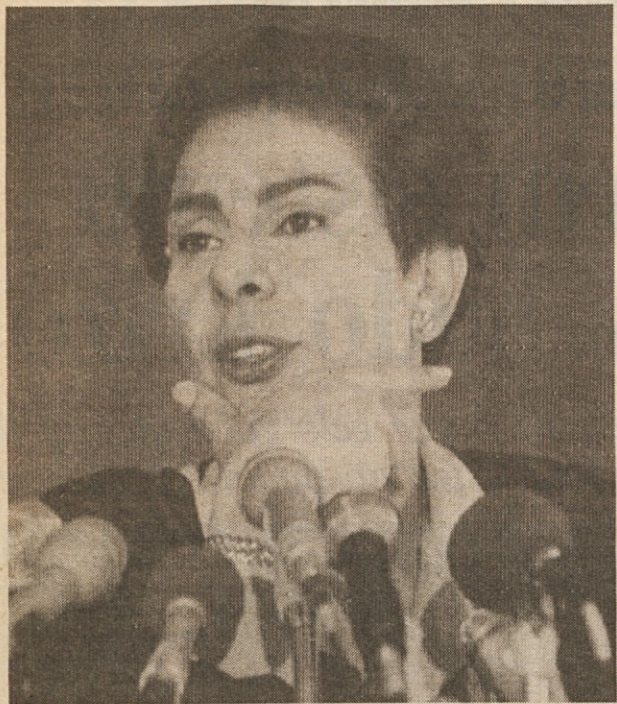
Glasnica palestinske delegacije Hanan Ašravi

TEL AVIV — Včerajšnje izraelsko časopisje obširno poroča o dvostranskih mirovni bližnjevzhodnih pogajanjih, ki so v torek v Washingtonu naletela na nove ovire. Istočasno naj bi v zakulisju že obravnavali nove izraelske predloge, pri tem pa naj bi v naslednjih tednih pomembno vlogo odigral tudi francoski predsednik Mitterrand, ki bo skušal posredovati med Izraelom in Arabci.