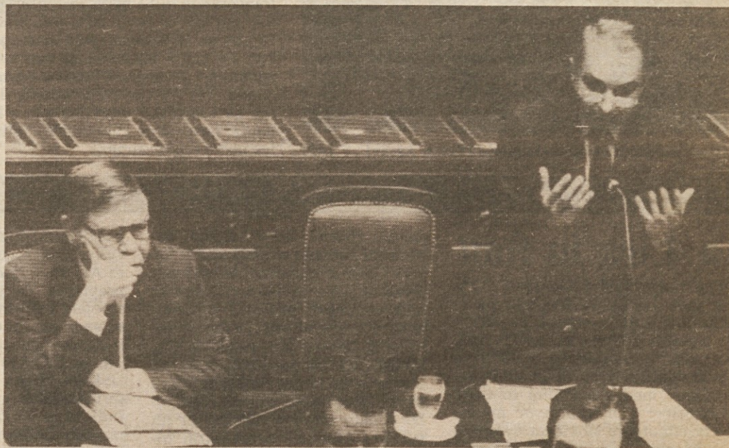
Ministrski predsednik Amato med včerajšnjim posegom v poslanski zbornici