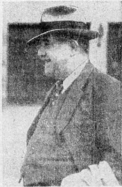
koj nato ustrelitev voditelja Železne garde Codreana in njegovih pajdašev; obisk francoske gospodarske delegacije v Romuniji; povišanje francoskega poslanstva v Bukaresti v veleposlanstvo.