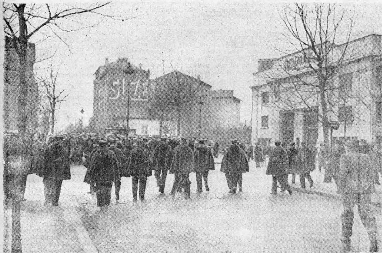
Na levi Policija razganja stavkujoče delavce, ki so se zbrali pred zaprtimi Renaultovimi tovarnami v okolici Pariza.