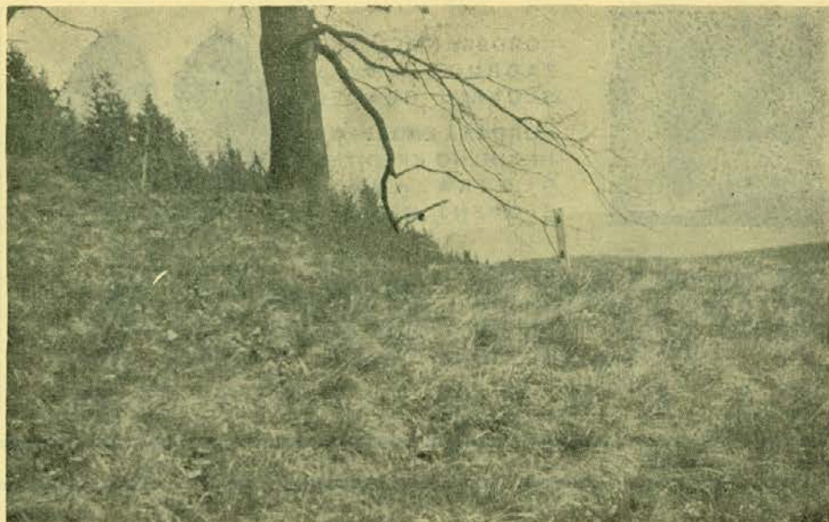
Pašniki so nared

ali okoli 3 kg suhe snovi na 100 kg žive teže.