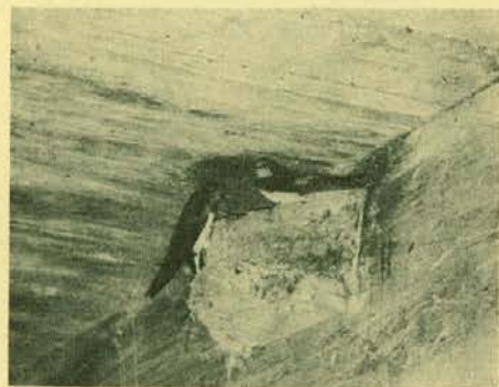
Lastovke, prve znanilke pomladi