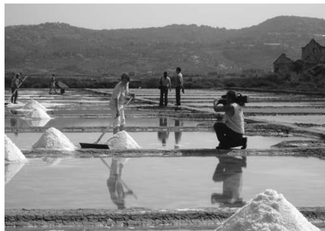
Mednarodni delovni tabori so s svojo medijsko odmevnostjo pomembno prispevali k popularizaciji Muzeja solinarstva v širši javnosti. Foto: Helmuth Holzmann, Sečovelje, 2005

lizacijo kulturne pokrajine, vključno z obnovitvijo solnih polj, z namenom pridobivanja soli po tradicionalni metodi v skladu in sozvočju z naravnim okoljem. K pridobitvi nagrade so pomembno pripomogli tudi mednarodni prostovoljni delovni tabori.