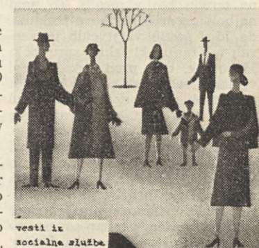
vesti iz socialne službe