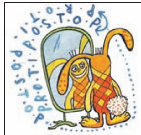
Ilustracije dajo že tako humorno podani resni snovi dodano vrednost, saj so otrokom všečne in simpatične.

nam pove Ana. Priročnik je začel nastajati pred petimi leti, ko se je sama pri sebi jezila na enega od učencev, ki mu je morala vedno znova razlagati lestvice in akorde. »Spontano sem začela risati kroge namesto notnega črtovja, not in števil. Ugotovila sem, da to deluje, in sem kasneje narisala še strip, da bi učencem bolj nazorno predstavila tudi nekatere druge teoretične lastnosti lestvic. Kmalu sem si zaželela, da ustvarim priročnik, ki bi skrajšal čas pri učenju osnov klavirskega igranja tudi drugim učencem in učiteljem. Pri tem sem želela, da ilustracije ustvari nekdo iz mojega okolja. Po naključju sem spoznala Anjo Polh, ki je res ustvarila ilustracije, ki otroke pritegnejo, saj so nabite s humorjem in barvami. Idealno je bilo, da je Anja v preteklosti igrala klavir in je zato razumela, kaj sem želela prikazati s svojo slikovno metodo,« še izvem. In res sta skupaj ustvarili vizualno všečno zgodbo o Juriju Duriju in bratih trojčkih s pomola, pa višjih in strip o Ficiju in Gidiju, nižaje in prigode pa jim predstavi Beno Eskim.