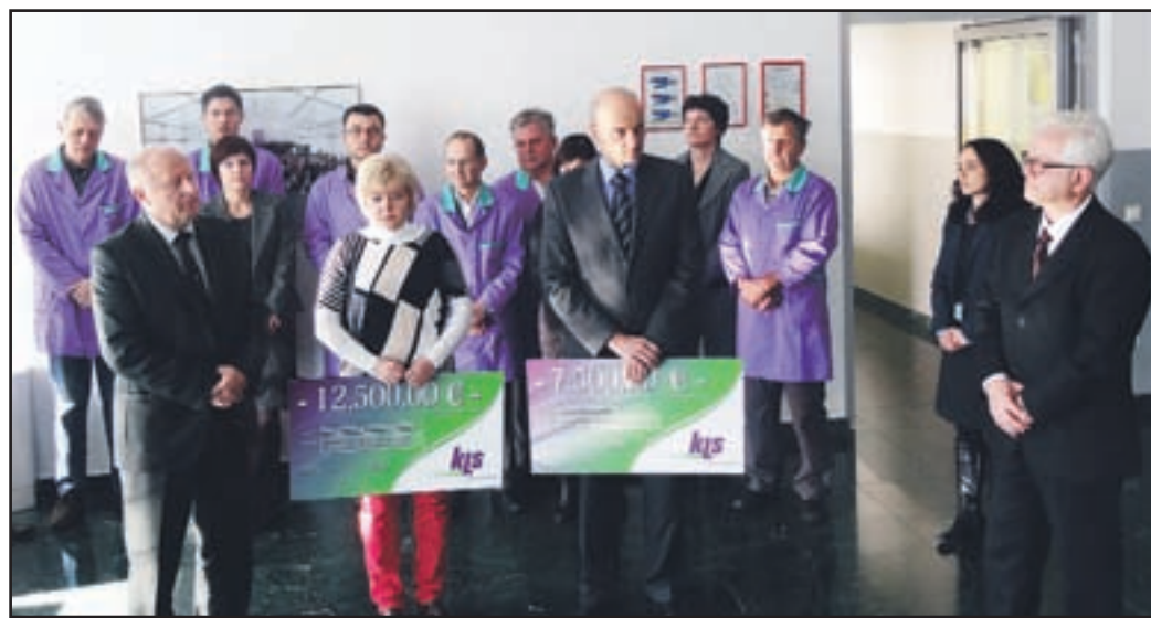
Tudi letos so donirali za potrebe bolnikov.

Prodaja naj bi letos znašala blizu 28 milijonov evrov, kar je 10 odstotkov več v primerjavi z lansko. Bruto dodana vrednost na zaposlenega je iz lanskih 76 tisoč evrov letos poskočila na približno 80 tisoč evrov, višji bo tudi dobiček. Lanski je znašal 5 milijonov evrov