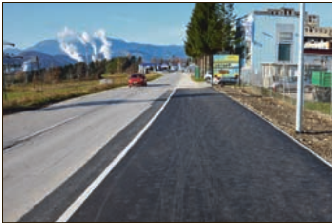
Do TRC Jezero bo pot tako za pešce kot kolesarje sedaj varnejša. Če bo denar, bodo dela nadaljevali že prihodnje leto.