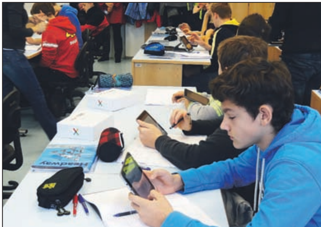
Od uvedbe sodobne učne metode si obetajo motiviranega dijaka in učitelja, ki gresta v korak s časom, predvsem pa več znanja.