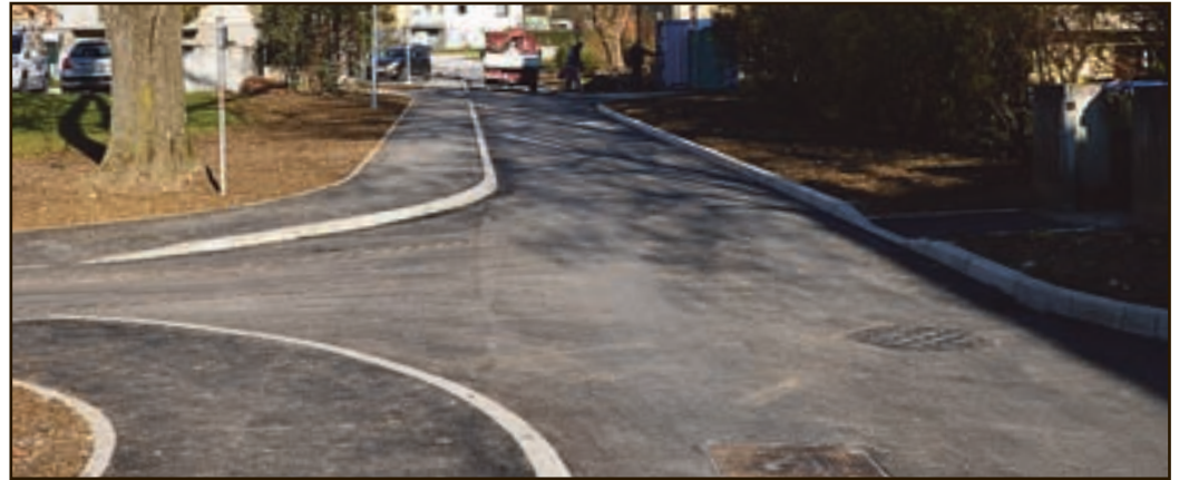
Dolga leta so si Velenjčani želeli pločnik ob Šlandrovi cesti. Končali so ga pred tednom dni.

Ob koncu minulega tedna so končali tudi prvi del pločnika od križišča pri starem kinu proti