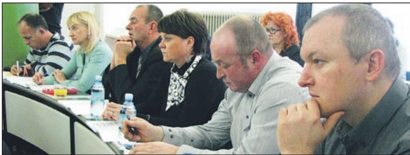
Zaskrbljenost – in razočaranje – na obrazih svetnikov.

pogledih tako enotni in tako pripravljeni.