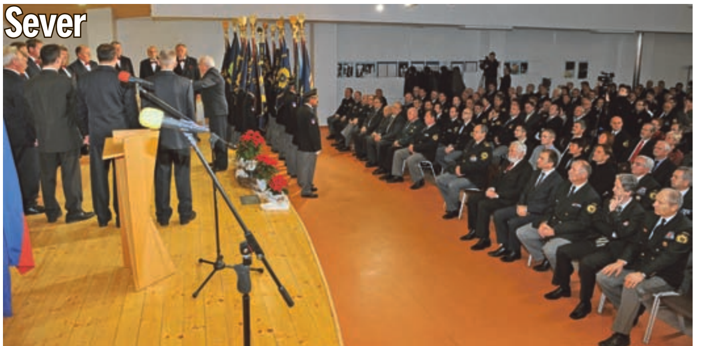
Udeležilo se ga je blizu 500 gostov in policijskih veteranov iz vse države.