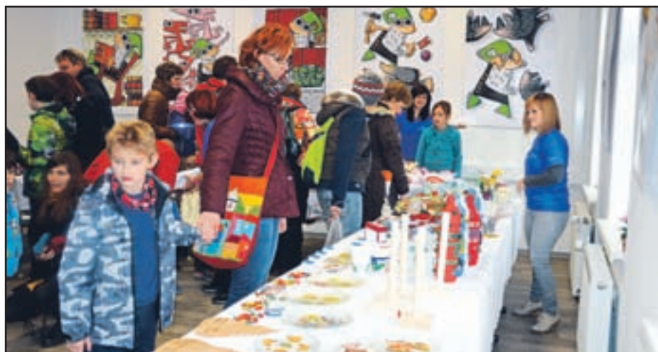
Pravo predpraznično razpoloženje so pričarali nastopajoči, ki so se predstavili v mansardi Vile Mojca.

14. novoletni darilni bazar v vili Mojca lepo uspel – Zbrali 1.720 evrov