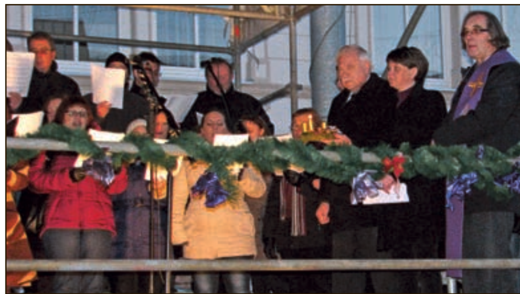
Obešanje adventnih venčkov nad trg bratov Mravljakov ima v Šoštanju tradicijo.