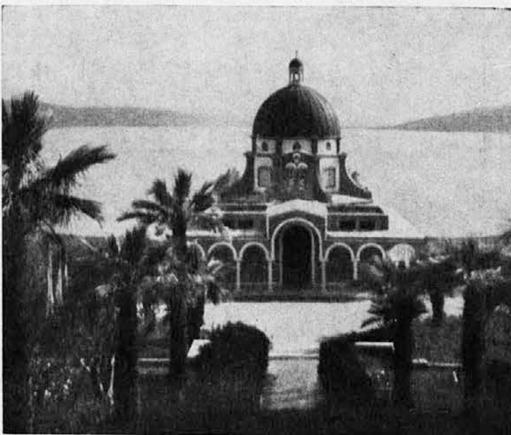
Gora blagrov, kjer je Jezus imel »govor na gori«