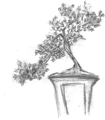
1. Bonsái pintado por Julio dentro de la ficción

Dentro de la novela Bonsái escrita por Alejandro Zambra, un personaje ficticio escribe un texto titulado Bonsái que remeda a la obra de Zambra. La similitud es tan deliberada que incluso en las páginas finales de la novela Julio pinta un bonsái sobre una hoja de papel, y el dibujo coincide con la portada del libro: