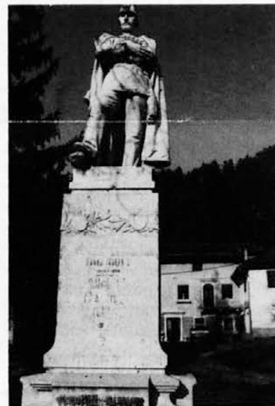
Spomenik baronu Andreju Čehovinu je bil prvotno postavljen leta 1898. Nato je bil pol stoletja skrit v zemlji. Končno je sedaj spet na svojem mestu

Na koncu še zanimivost. Baron Andrej Čehovin je menda daljni pred-