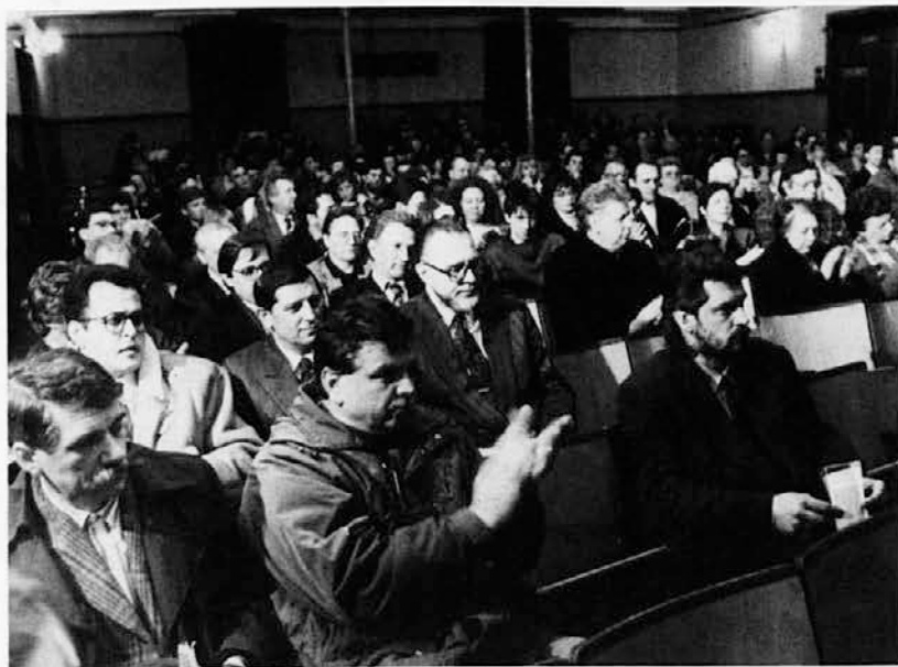
Otvoritvenega večera 7. Film Video Monitorja v Gorici se je udeležilo številno občinstvo. Navzoč je bil tudi minister za Slovence po svetu Janez Dular (tretji z leve v drugi vrsti)