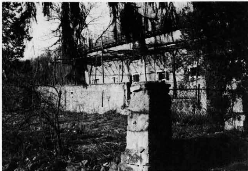
Vrt pred hlevom »Rokcevi« domačije, kjer je bil spomenik zakopan