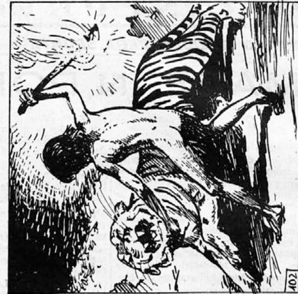
102. »Tale klavec govodi se je bahal, da me bo nočoj ubil, ker me ni mogel, ko sem bil še mladiček!« je vpil jezni deček. »Takole, vidiš, pa ljudje pretepamo pse! Samo zmigni z brki, pa ti porinem rdečega cvetja v žrelo!« In udrihal je po Sir Khanovi glavi z gorečo vejo, tiger pa je ves preplašen cvtil. Tedaj se je Mavgli spomnil Akela.