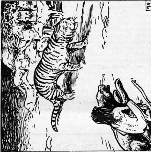
98. Akela, samotni volk, je ležal ob skali in mesto vodnika je bilo prazno. Sir Khan se je ponosno sprehajal med mladimi volkovi. Mavgli pa je počepnil k Baghiru in obdržal lonček med kolena. Z obsodbo starega vodnika se volkovi niso dolgo ukvarjali. Ze ko je zgrešil plen, je bila njegova usoda določena in klicali so ga le še »mrtvi volk«.