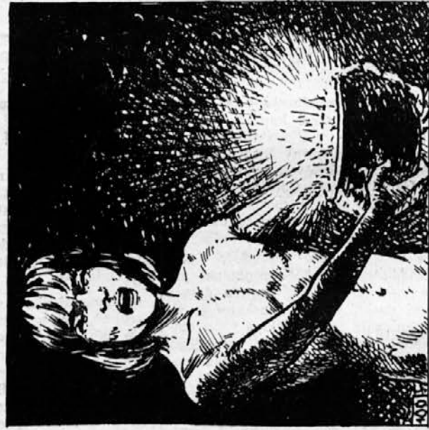
100. »Poslušajte!« je zavpil, »Nocoj ste mi tolikokrat vrgli v obraz, da sem človek, da se ne morem več šteti med vas. Niste mi več bratje, imenoval vas bom pse — edino ime, ki vam ga kot človek lahko dam. In videli boste, da sem res človek! Poglejte rdeče cvetje, ki sem ga prinesel s seboj.« In stresel je žareče oglje na suhi mah.