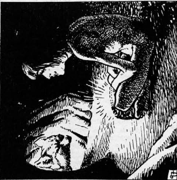
97. Ves dan je sedel Mavgli v votlini ob svöjem lončku in nalagal vanj suhe veje. Izbral je dolgo vejo, ki mu bo zvečer potrebna, in končno našel pravo. Ko ga je prišel šakal Tabaki škodoželjno in nevjudno klicati na sestanek, se mu je samo zaničljivo smejal. Še malo je počakal, potem pa se je z lončkom in vejo odpravil na Skálo sveta