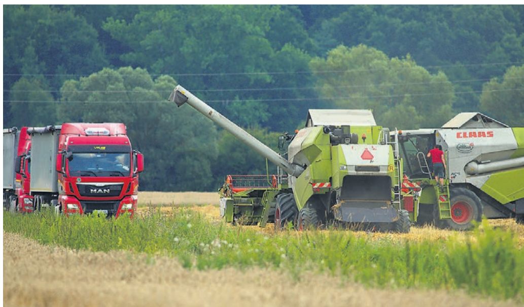
Cene med strojnimi krožki se precej razlikujejo, prav tako med izvajalci storitev.