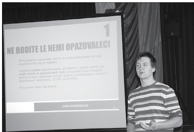
Vsaka pomoč je boljše kot nič, so med drugim slišali udeleženci obnove tečaja prve pomoči v Radmirju.

Prostovoljno gasilsko društvo Radmirje je v ponedeljek, 17. februarja, pripravilo obnove tečaja prve pomoči za svoje člane kot tudi ostale krajanje. Znanje prve pomoči, neposredne oskrbe, ki jo dobi poškodovani na kraju dogodka in čim prej po dogodku, je namreč lahko življenjskega pomena. Težava je v tem, da pri marsikom zbledi hitro po opravljenem tečaju, zato so pomembni obnove tečajji, ki jih izvajajo študentje medicine v okviru svojega društva.