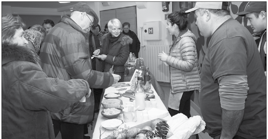
Po predavanju je sledila degustacija domačih pridelkov in izdelkov.