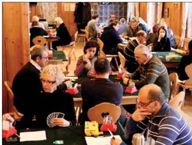
Na 4. mednarodnem turnirju v hotelu Plesnik je sodelovalo petdeset igralcev bridža iz Slovenije in tujine.