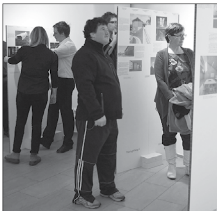
Na razstavi je predstavljenih 30 nominiranih projektov trajnostne arhitekture, med njimi tudi solčavski Center Rinka.

Razstava je bila na ogled že v Švici in Avstriji, od januarja pa gostuje po Sloveniji. Na njej je predstavljenih 30 nominiranih projektov trajnostne arhitekture. Med njimi je tudi Center Rinka – večnamensko središče za trajnostni razvoj Solčavskega, ki je lani septembra v Bernu prejel mednarodno nagrado za trajnostno gradnjo v Alpah. V obrazložitvi nagrade je strokovna komisija zapisala, da Cen-