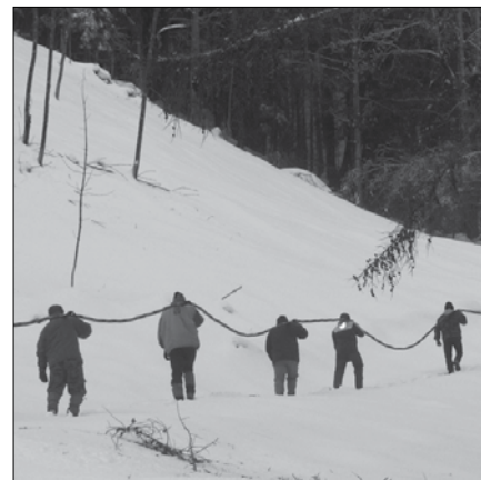
Sedemdeset občanov je potegnilo en kilometer kabla po izjemno strmih in nedostopnem terenu.

Veliki dogodki ponavadi izpostavijo velike ljudi. Tako so se v nedavni ujmi z žledom poleg gasilcev in pripadnikov civilne zaščite z nesebično pomočjo izkazali številni posamezniki. A v občini Solčava junakov ni bilo le za prste ene roke, bilo jih je kar sedemdeset, ki so pomagali vzpostaviti pretrgano električno napeljavo in sokrajanom zagotovili prepotrebno električno energijo.