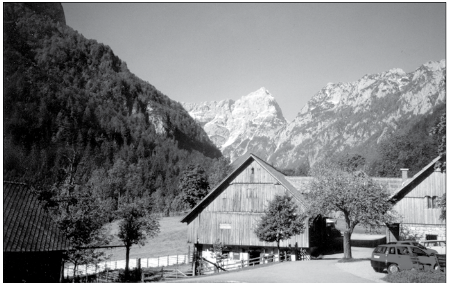
Lepota Robanovega kota.