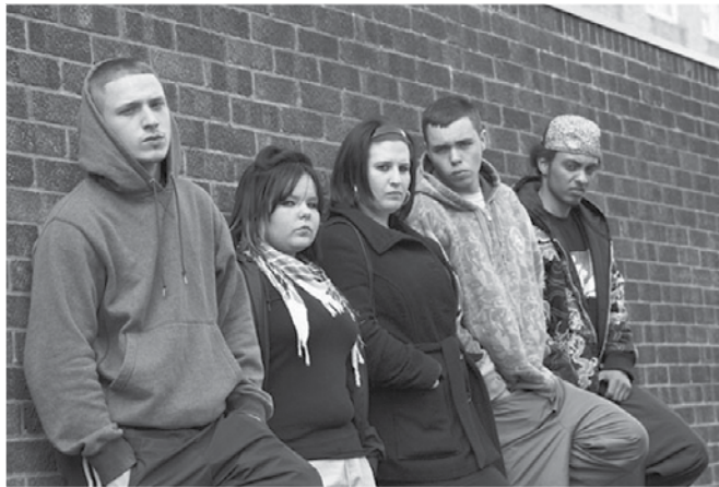
Množična brezposelnost mladih predstavlja vseevropski problem.

čen čas. Delodajalci so že sporočili, da bodo ukrepe vsekakor izkoristili, vendar le v primeru, če bodo lahko odpirali nova delovna mesta.