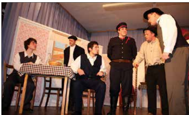
V gostilni pacienti prepoznajo goljufa in srečanje z resnico je neizbežno.