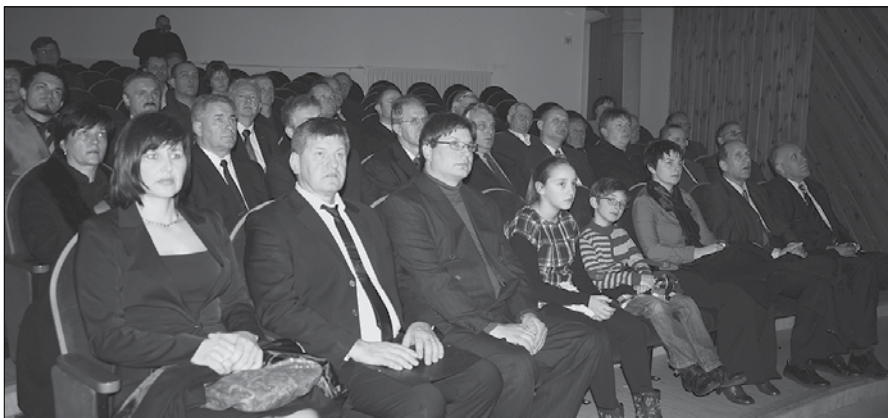
Žalne seje so se poleg svojcev udeležili številni člani in simpatizerji SLS ter predstavniki lokalnih skupnosti.