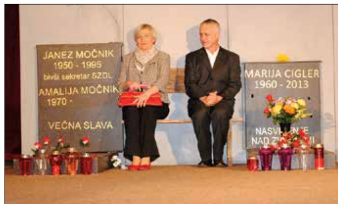
Osrednje prizorišče Partljičeve komedije z nadvse duhovitimi dialogi je pokopališče.