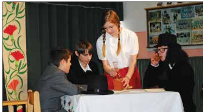
Učenci so uprizorili tudi dogodek s Francetom Prešernom in njegovimi prijatelji.