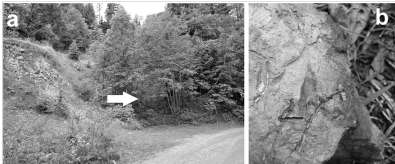
Sl. 2. Natančnejši položaj najdišča primerka zoba ob cestnem vseku (a). Zob takoj po odkritju, še vedno v prikamnini (b).

Fig. 2. Picture of locality at road cut (a). Described tooth, photographed immediately after the discovery.