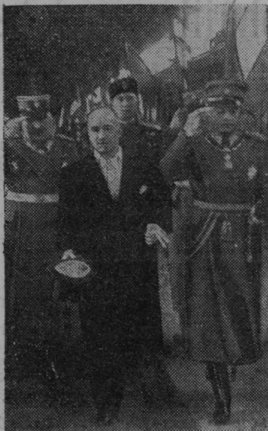
Predsednik dr. E. Beneš v spremstvu kneza-namestnika Pavla.

Dne 6. IV. je obiskal dr. Beneš v spremstvu kneza namestnika Pavla, njegove soproge, predsednika vlade dr. Stojadinoviča in čehoslovaškega zunanjega ministra dr. Krofte grobnico kralja Aleksandra v Oplencu, kjer je počastil spomin pokojnega vladarja z enominutnim molkom ter z vencem.