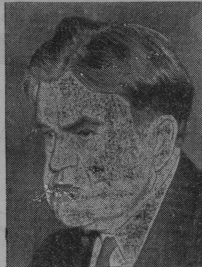
John L. Lewis, ameriški delavski voditelj ter povzročitelj zadnjih velikih stavk v Združenih državah.