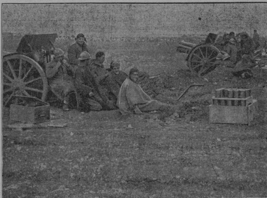
Nacionalno špansko topništvo pripravlja s streljanjem ofenzivo.