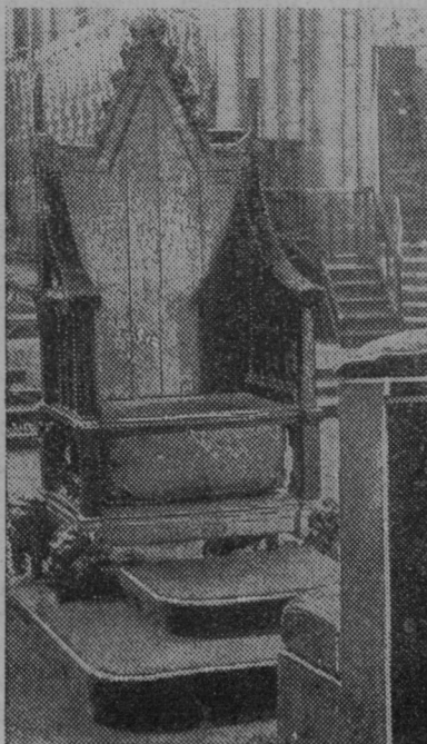
Stari prestol v vestminstrski opatijski cerkvi v Londonu, v katerem bo sedel kralj Jurij VI. med kronanjem.