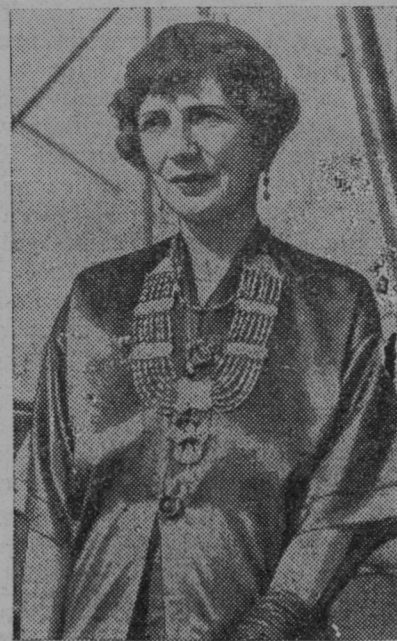
Indijska kneginja, soproga edinega belega indijskega kneza v Saravaku, se bo kot rojena Angležinja udeležila kronanja angleškega kralja Jurja VI.