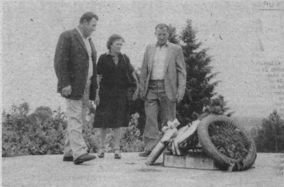
Invalidi z Ježice so položili venec pri spomeniku padlih za svobodo v Žužemberku.