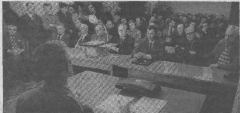
Že v januarju je občinska konferenca ZRVS Ljubljana Center organizirala po vseh svojih krajevnih skupnostih predavanja o sodobni vojaški politični situaciji na svetu z vplivom na položaj in varnost SFRJ. Vsebinska predavanja sodi v obvezni spored rednega izpopolnjevanja znanja naših rezervnih starešin. Mnoga izpitna vprašanja starešinam bodo letos prav iz te teme.

tetnejši vpliv združenega dela na vsebino predlaganih sporazumov.