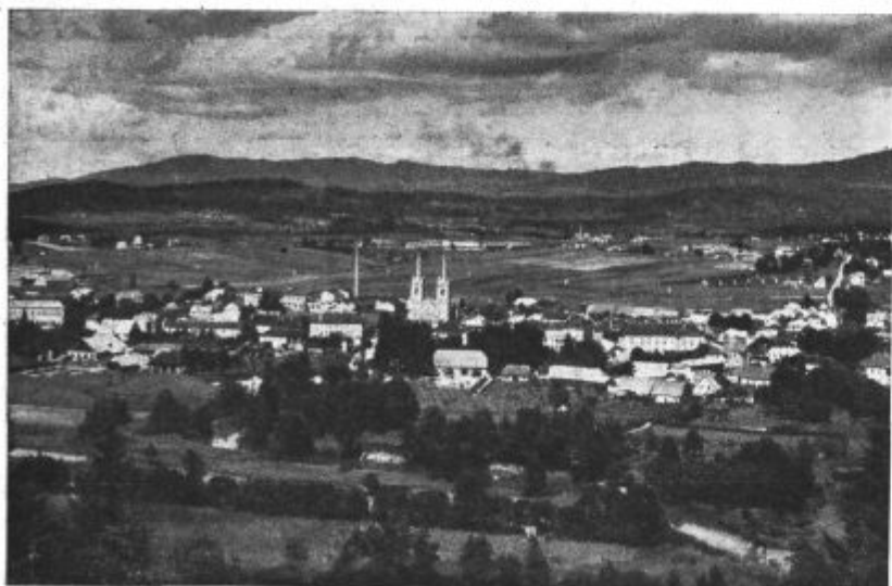
Pogled na mesto Kočevje.