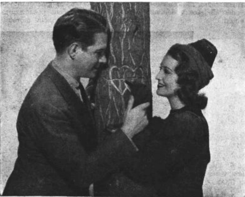
Nelson Eddy in Jeanette Mac Donald v filmu »Zaljubljenca«.