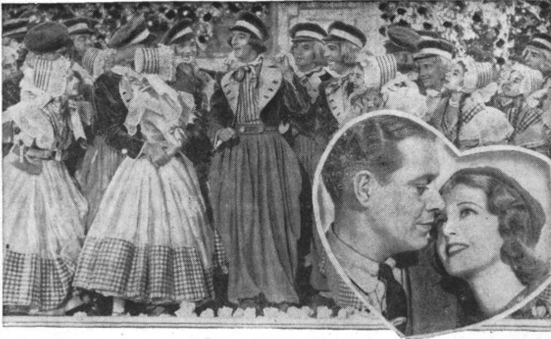
Iz filma »Zaljubljenca«. Kino »Union«.