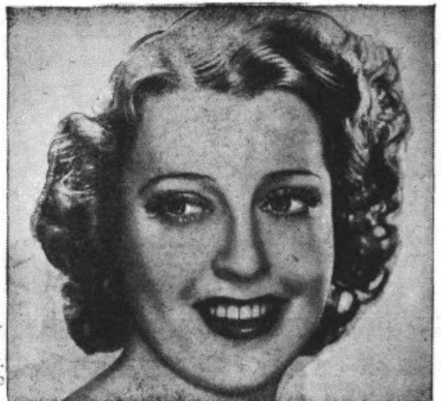
Jeanette Mac Donald. Slišali jo bomo v razlošnem pevskem filmu »Z a l j u b l j e n c a«. Film ima na sporedu kino »Union«.

Novejši slovenski glasbi bi radi pripomogli do čim širšega udejstvovanja najprej s prirejanjem glasbenih večerov, ki so posvečeni posameznim skladateljem; na ta način moremo