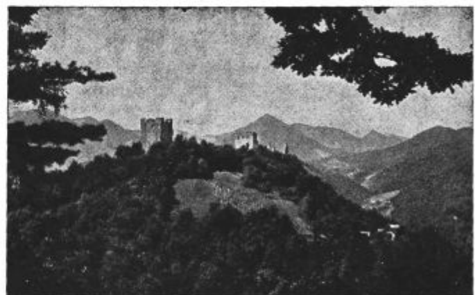
Znameniti zgodovinski celjski Stari grad