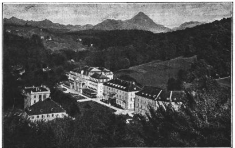
Pogled na Rogaško Slatino.

6.30 Budnica. Telovadba. ●. ○. 11.50 ● o stanju vode. 12 Zvonjenje. Nato