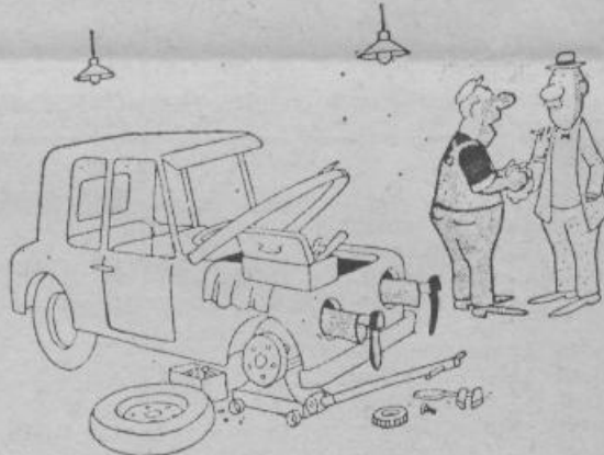
— Izmenjajte vse, saj plača zavarovalnica!

Položaj lastnika avtomobila se je družbeno že toliko okreplil, da ga štiti tudi zakon in prometna milica. Vse ravne, gladke, asfaltirane in sploh vse najlepše ceste so popolnoma osvojili avtomobilisti. Zakon je namreč razglasil te ceste za avtomobilske in prepovedal pešcem vsak dostop nanje.