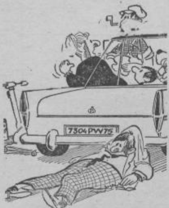
Avto lahko pohodi pešca, na sprotro je nemogoče

Z ozirom na vrstni red obeh črk v abecedi (»A« kot 1. in »P« kot 17.), pa tudi zaradi drugih okolnosti, so avtomobilisti cenjeni, pa tudi sami se imajo za nekaj več kot so navadni smrtniki-pešci. Za to imajo dobre razloge. Avtomobilist lahko »pohodi« pešca, pešec pa ne more pohoditi avtomobila oziroma avtomobilista. Avtomobilist predirja s svojim vozilom v eni uri najmanj 80 km, pešec pa z maksimalnim naporom in v potu svojega obraza prehodi komaj 5 km na uro. Avtomobilist lahko s svojim vozilom vozi tudi druge osebe (seveda po lastni izbiri in odločitvi). Ubogi pešec pa ne oziraje se na njegovo željo, pogosto komaj nosi samega sebe (zlasti če. no...).