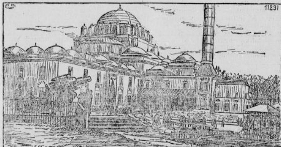
»Debela Berta« v Štambulu (Carigrad).

Navadna pesa je prav dobra kрма. Vsi pa vemo, da ni posebna za pitanje. Pozimi kaj rada gnije, spomladi je treba kmalu vse vun pometati; jese-