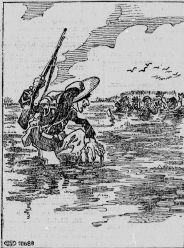
Rešitelj. — O Dio mio, zdaj sem pa sam, not'.

Posledica angleškega poraza v Skager-Racku. Angleška admiraliteta je ukazala, naj se vse vojne ladje vrnejo z Atlantskega morja na Angleško.