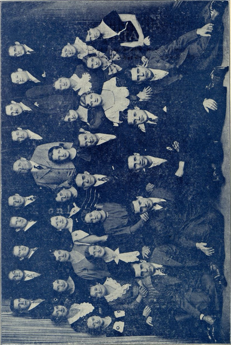
PEVSKI ZBOR 'DOMOVINE' OB 25 LETNICI