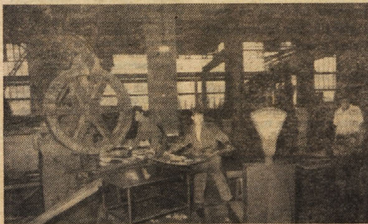
Ko pločevino zvaljajo, jo je treba stehati in obrezati

Metaliziranje ima to prednost, da ga lahko izvajamo na prostem in ni omejeno na zaprt prostor. Kvaliteta zaščitnega sloja je odlična in zato ta po-