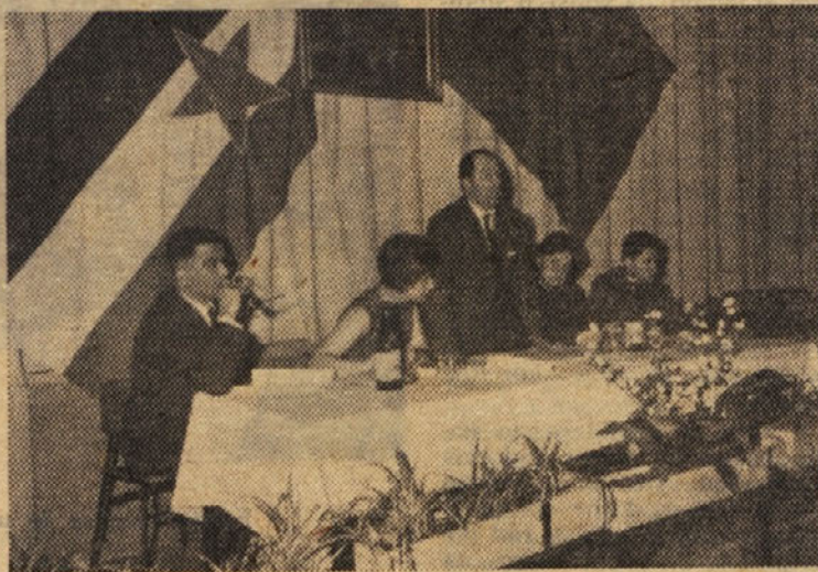
Delovno predsedstvo na rednem letnem občnem zboru naše sindikalne podružnice

tesno povezane še mnoge naloge, ki jih bomo morali reševati s skupnimi napori.