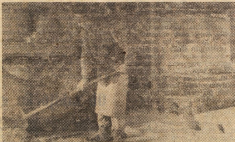
Saržiranje thede peči je končano.

Ta panoga razpolaga z dovolj kapacitetami, vendar so te preveč razdrobljene. Z boljšim izkoriščanjem in modernizacijo kapacitet bo še nadalje omogočen porast, čeprav bo večja proizvodnja morala biti dosežena s posebno organizacijo dela in izboljšanjem kadrovske strukture. V proizvodnji obutve bo bo spremenjena struktura repromateriala — naravne kože bodo nadomestili umetni materiali. Pričakovati je, da bo v letu 1967 potrošnja obutve dosegla današnjo potrošnjo v razvitih državah.