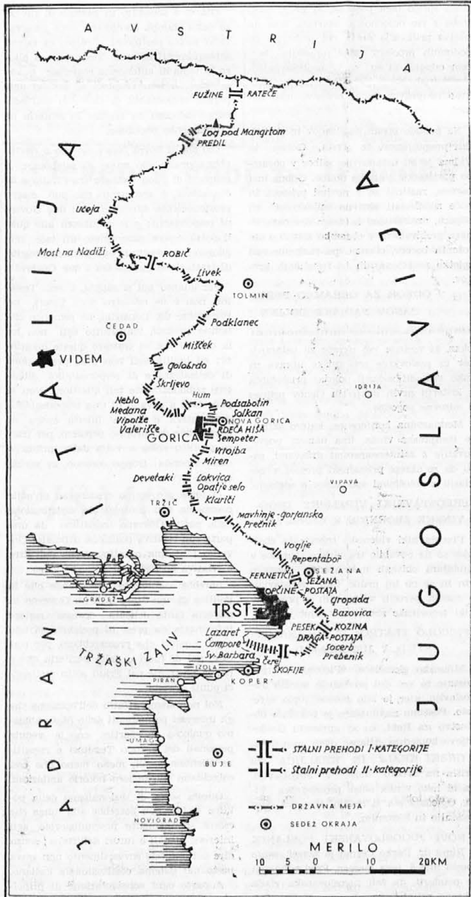
PREGLED OBMEJNIH PREHODOV, KI JIH DOLOČA VIDEMSKI SPORAZUM

Odnjetá giunta kumunal na je formana od tjeih može: Uigio Filipić - šindik, Noacco Kostantin, Sedola Uigio - Zvanočo, Zussino Evgen - Duóvič, Šimic Pio asešorji. Asešorji suplenti no reštaju Tomasino Elio an Filipić Tilio.