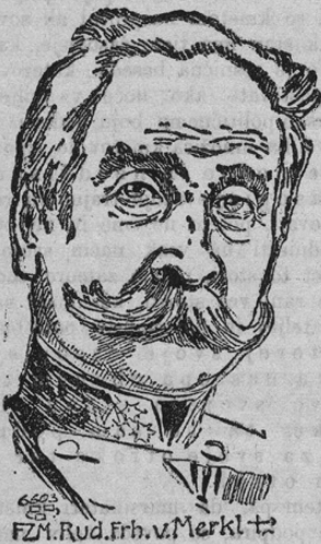
FZM. Rud. Frh. v. Merkl †

Naša slika kaže feldcajgmajstra pl. Merkl, ki je te dni umrl. Merkl je bil eden redkih Radetzkyjevih vete-