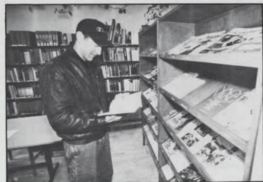
Bralcem so na razpolago dnevnik, strokovne revije itd.

čarjev. Po enoletni izkušnji lahko povem, da so moji sodelavci strokovno dobro pripravljeni, zelo se trudijo. Veselje je delati z njimi. Precej nam olajša delo računalniški sistem. Knjiž-