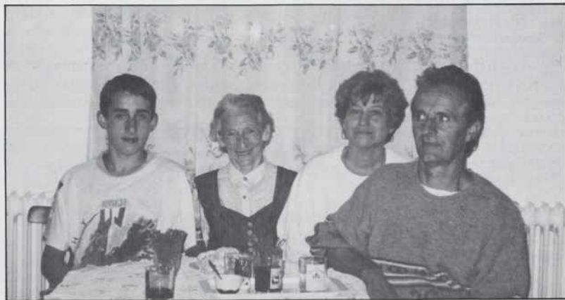
Dravecovi: bratov sin, mati, žena, Karči

- Ge sam zdaj zato sé prišla, ka naj se malo dobro čütim pa se malo vóodkapčim. Malo sva s svojim vnükom z Gorenjoga Sinika prišla "po vési". Un se je malo to vónavozo, naj se malo veseli, ka de doma bole volau emo delati.