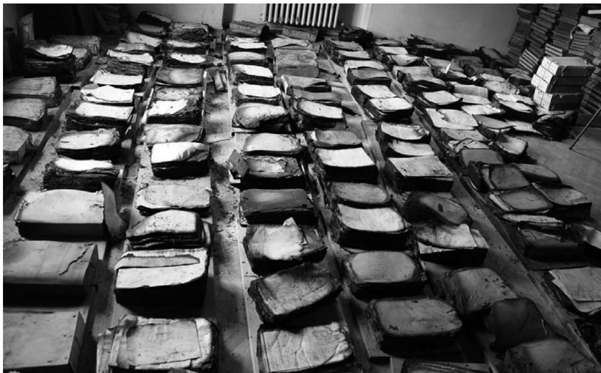
Slika 3: Oštećeni dokumenti u Arhivu Bosne i Hercegovine

Ovisno o vrsti dokumenta, vrši se izbor formata filma - 35mm se koristi kada su dokumenti različitih dimenzija (uglavnom većih od A4 standarda), na različitim vrstama papira i gdje je česta kombinacija tiskanih slova i rukopisa. U slučaju dokumenata standardnih dimenzija i homogenijeg zapisa, koristi se 16 mm.