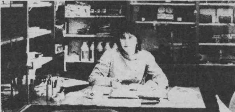
V prodajalni na Trgu osvoboditve 2 je najlažje dobiti predstavo o dejavnosti delovne organizacije Kemoservis - Fotomaterial.

viji, ki ga je podelilo Društvo fotografskih delavcev Jugoslavije. Druge prodajalne so še na Cankarjevi cesti 7, Kar-