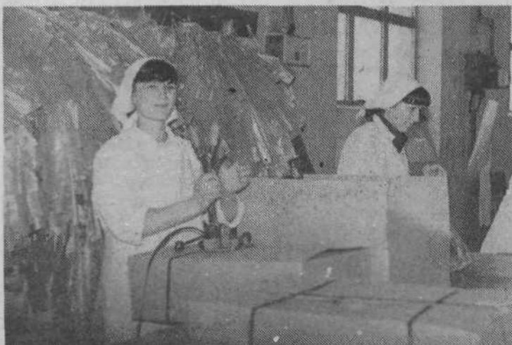
V TMI, Mesarska 1, pripravijo letno okrog 5500 ton mesa in 3500 ton mesnih izdelkov. Lani so s tem pridobili 1,32 milijarde dinarjev prihodka. Precejšen del so ga ustvarili tudi z izvozom v dežele v razvoju. Na sliki: pakiranje mesa in mesnih izdelkov v TMI za izvoz