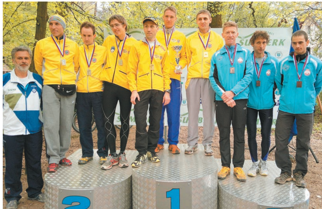
Dvojna članska zmaga.

sezek naših članov, vsem iskreno čestitamo!