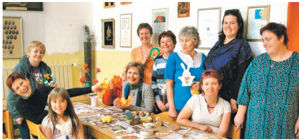
Perovanje nam bo ponudilo veliko najrazličnejših ustvarjalnih delavnic. Z druge perovske medgeneracijske, tokrat velikonočne delavnice, ki je potekala ta ponedeljek. Da bi te le prerastle v nekaj več ...