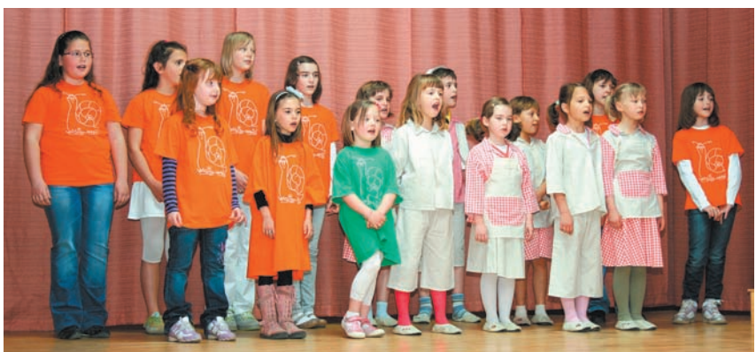
Drugi dan posveta so motniški polžki na zanimiv način predstavili posebnosti svoje vasi in okolice in povabili goste, da se v njihov kraj ponovno vrnejo.

skupnih strokovnih ekskurzij v zamejstvo. Priložnost za srečanje s kolegi je tudi strokovni posvet, ki ga vsako leto pripravi ena od podružničnih šol.