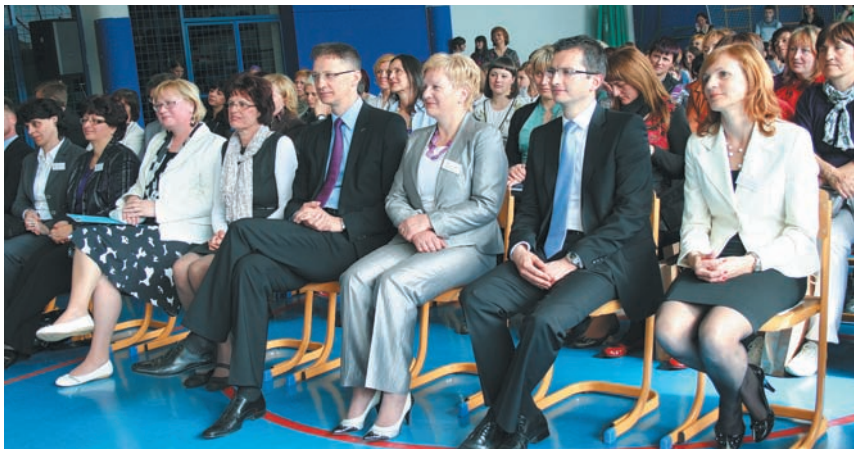
Slavnostni gost 11. strokovnega posveta Društva podružničnih šol minister Igor Lukšič je spregovoril o trenutnih razmerah v naši družbi, predvsem pa poudaril pomen ohranjanja podružničnih šol.

Po končani prireditvi so si gostje ogledali razstavo likov-