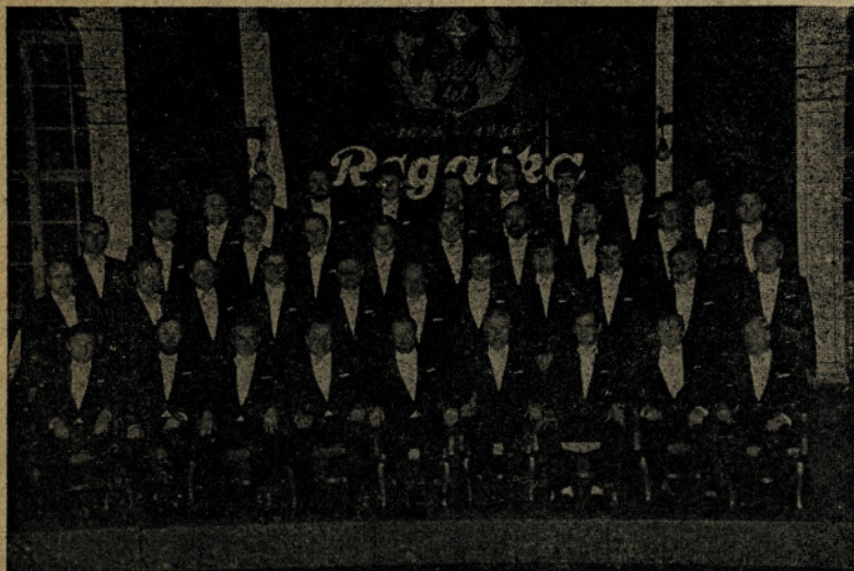
Cestitka in zahvala za 20 uspešnih let moškega pevskega zbora »Zdravilišča Rogaška Slatina«.