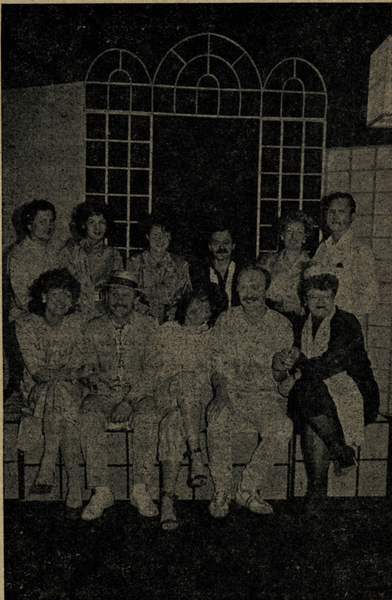
Igra Edwarda Albeeja Vrt, v izvedbi šmarske gledališke skupine, pomeni pomemben napredek celotnega ansambla. Na sliki: igralci na premieri 14. 3. 1986