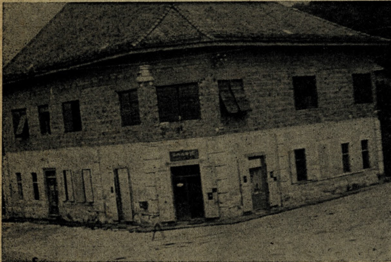
V tej stavbi je bila prva Jelšina Trgovina

V DO smo si postavili smeje načrte in naloge za naše delo. Prva naloga je bila specializacija trgovin in posodobitev poslovnih prostorov.