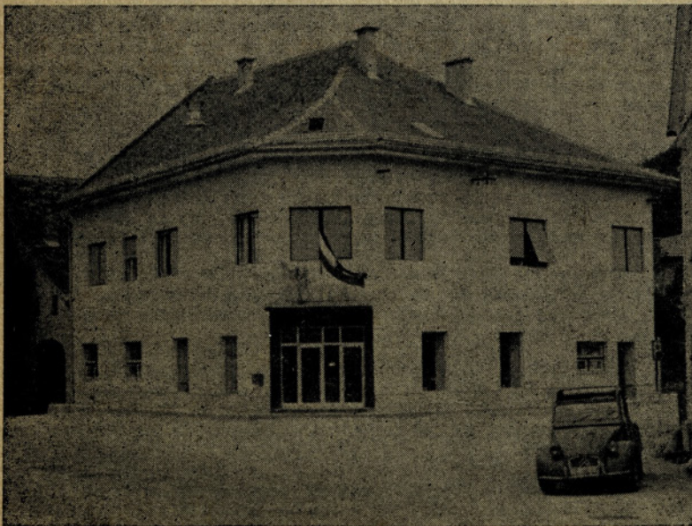
Tretja samopostrežna trgovina v Sloveniji

Nadaljevali smo z novogradnjami in danes smo lahko ponosni na markete v Rog. Slatini, Kozjem, Lesičnem, Mestinju, v spominskem parku Trebče — Bistrica ob Sotli, Rogatcu, ter na samopostrežbe v Kristanvrhu, Sentvidu, Zibiki in drugje ter na trgovsko-gostinski center v Šmarju pri Jelšah. Vendar pa je ta močna investicijska dejavnost in usmerjenost v ustvarjanju čim večje akumulacije v veliki me-