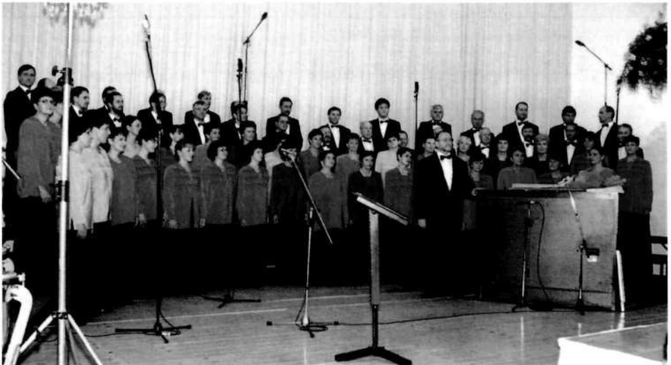
Pevski zbor Lubnik: slavnostni koncert ob dvajsetletnem jubileju v Kristalni dvorani na Mestnem trgu

Kot pomeni kristal posebno vrednost med stekli, pomeni poimenovana kristalna dvorana prav posebno vrednost, opomin in izziv občini, da se resnično loti tega možnega hrama glasbene kulture.»