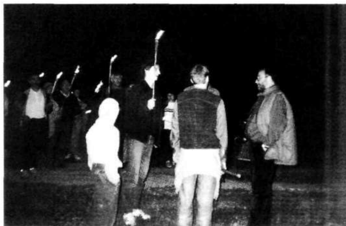
Pevski kvartet v soju bakel v logaškem pragozdu

Saj nas kar zona spreletava. Prijavi se čuda ljudi. Ob osmih zvečer je odhod. Težko se zbašemo v avtobus. Pelje nas v neznano. Nekateri prepoznajo kraje, skozi katere se vozimo iz Škofje Loke na avtocesto. Eni so prepričani, da se peljemo skozi Borovnico, potem pa je pot čedalje manj asfaltirana, čedalje bolj luknjasta in vse bolj strma. Srečno pridemo mimo Pekla pri Močilniku. Zanaša nas zlasti na izredno vijugastih ovinkih in včasih se bojimo, da avtobus ne bo zmožgel strmine klanca. Ob devetih zvečer smo v Pokojišču. Polna luna čarobno osvetljuje gozdove pred nami. Dva sta »zagvišno« prinesla s seboj sekire. Nekateri smo zaradi tega celo bolj vzne-