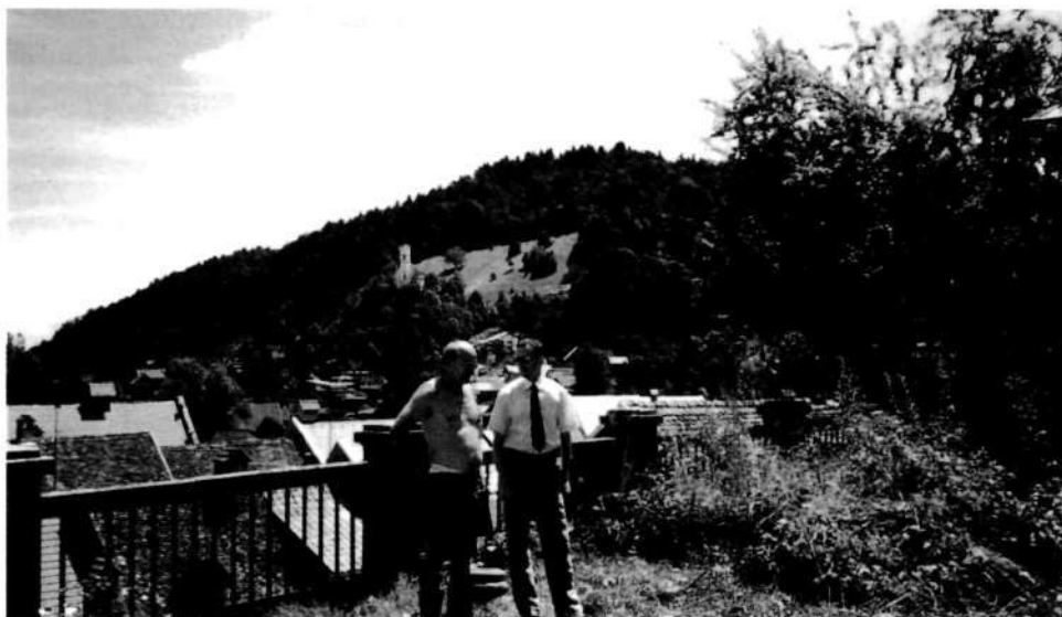
Županski obisk na zelenici pred dvorano