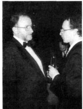
Dogovor je sklenjen – Ljubljana 1994

Do semena, ki je želelo vzkliti, se je dotopal prvi sončni žarek. Z obetom pomladi, rasti, uresničitve.