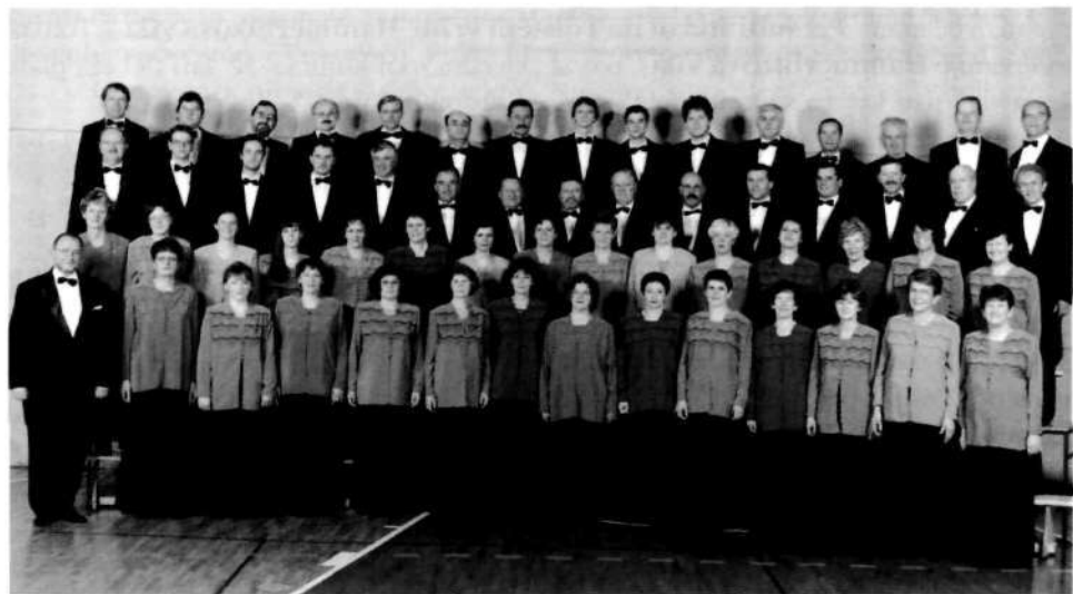
Pevski zbor Lubnik ob dvajsetletnem jubileju 1999

Spreminjamo se v sebi. V nas se prebujajo čudeži novih zmožnosti, novih spoznanj, novih čutenj ... Morda nam požrtvovalno prihajanje na vaje, druženje in petje ob večerih pomeni ravnovesje za težka in naporna dogajanja delovnega dne. Morda nam v tej polarnosti prihaja naproti tisto duhovno, ki ga v dirki za materialnim ne slišimo, ne iščemo, ne vidimo več. Nam te dejavnosti prinašajo notranjo rast? Prepoznavanje neslutelih zmožnosti, ki spijo v vsakem izmed nas, pa jih večče in prijateljsko vodenje prebujajo v delovanje in ogenj? Kaj pa če nam to napeto in drugačno delo osvobaja naše višje sposobnosti, ki se sprostijo samo preko napora, prizadevnosti in predanosti? Ko se duša prebije skozi spono zemeljskega in so pred nami nova obzorja – obzorja božanskega! Ko se mučimo za pravi ton, za ravnotežje