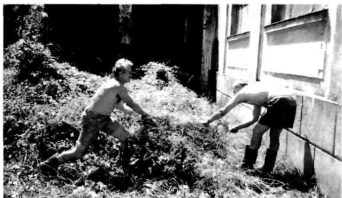
Čiščenje goščave pred dvorano

Zbor, ki se vneto pripravlja na jubilejni koncert ob dvajsetletnici delovanja (to pomeni korepeticije, vaje za en zbor – PZ Lubnik, vaje za drugi zbor – Glasbena matica Ljubljana, skupne vaje za oba zbora, vaje z orkestrom in orglami, preizkus dvorane) začne ustvarjalno slediti ideji svojega dirigenta. Dvajsetletni jubilej bomo praznovali doma, v Škofji Loki.