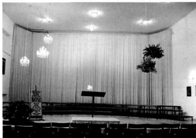
«Nevesta» pričakuje «ženina»

Kako smo vsí skupaj napravili nekaj lepega