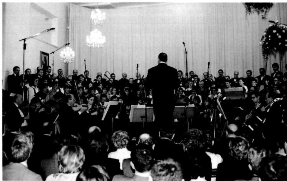
Ponovitev slavnostnega koncerta

V imenu občine in v svojem imenu bi se želel zahvaliti vsem pevkam in pevcem PZ Lubnik, ki so nam dvajset let polepšali marsikateri večer, mnogo prireditel in mnogo liturgičnih slavij.