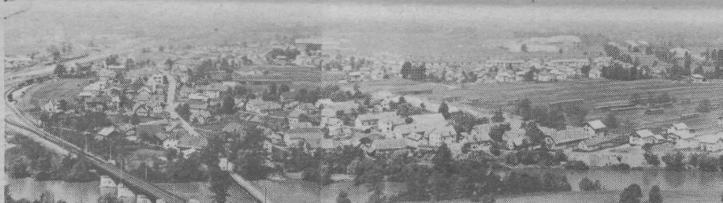
Današnji Zalog. Že bežen pogled na fotografijo in primerjava le-te s posnetkom pred vojno nam zgovorno pričajo o tem kako naglo se Zalog razvija

perutinsko farmo, iz nekdanjega manjšega obrata Agrokombinata je razvil podjetje Saturnus sodoben industrijski obrat, poleg pa je še obrat Koteks-Tobusa. To je za tako kratko dobo velik dosežek, saj ta podjetja oz. obrati zaposlujejo skoraj toliko delavcev, kot je bilo pred 20 leti vseh prebivalcev Zaloga in Sp. Kašlja. S tem pa industrijski razvoj Zaloga še ni zaključen, saj je po urbanističnem načrtu na zahodni strani naselja rezervirana za industrijo že ogromna površina.