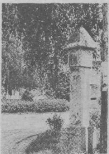
V letu 1739 je tudi v Zalogu razsajala kuga. Na to hudo nadelogo, ki je pomorila veliko vaščanov, nas spominja tole kužno znamenje

Elektrika je prvič zasvetila v Zalogu leta 1926. Zaradi drage napeljave in relativno visoke cene električnega toka je Založani niso takoj vsi napeljali po domovih in pred 20 leti je bilo še približno 30 % hiš (predvsem v obrobni predelih) ob večerih razsvetljenih s petrolejkami ali na karbid. Po letu 1955, ko so v Zalogu začeli z gradnjo večjih