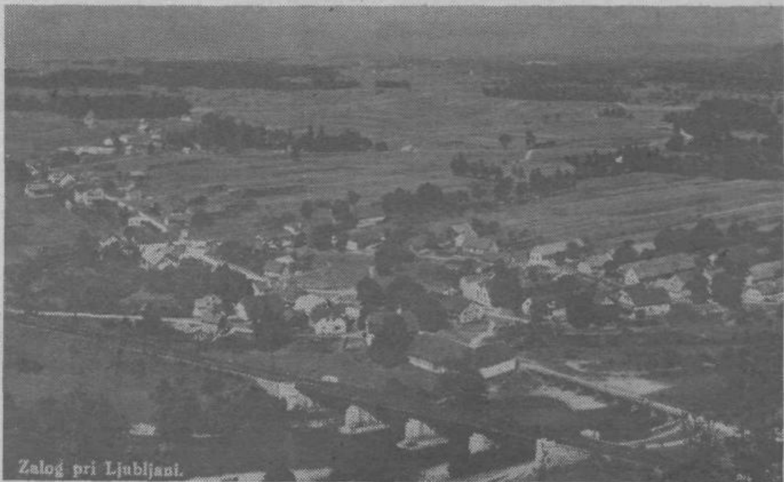
Zalog pri Ljubljani.

Takole je izgledal Zalog nekaj let pred drugo svetovno vojno