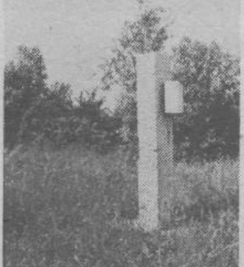
Približno sto metrov od mostu čez Ljubljaničo stoji spomenik. Tu v bližini je bila v juniju leta 1940 pokrajinska konferenca SKOJ za Slovenijo

Higiena bi lahko dosegla zelo visoko raven, če bi naselje imelo urejeno kanalizacijo. Del naselja so priključili kanalu, ki poteka od mesne industrije, večina pa še vedno spušta fekalije in odpadno vodo v razne ponikovalnice, kar iz zdravstvenih razlogov nikakor ni v redu. Skozi Zalog so začeli graditi glavni odvodni kanal (kolektor) iz Ljubljane, zato Založani upajo, da bodo odgovorni kmalu našli finančna sredstva tudi za sekundarno kanalizacijo omrežja.