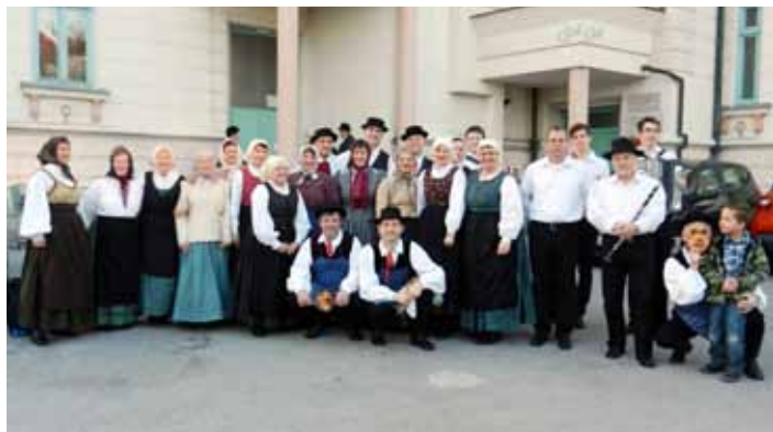
Cela skupina na območnem srečanju v Domžalah, 8. marca 2014