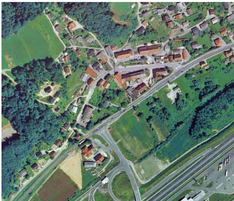
Območje ureditvenega načrta L1 Lukovica center

Občinski svet Občine Lukovica je na 21. seji v začetku junija sprejel Odlok o spremembah in dopolnitvah Odloka o ureditvenem načrtu območja L1 Lukovica center. Osnovni odlok je bil sprejet leta 2004 ter leta 2005 tudi že njegove spremembe in dopolnitve. V naslednjih letih je bila izvedena rekonstrukcija oz. ureditev osrednjega dela naselja, zaradi česar je nastala potreba po uskladitvi načrta z dejanskim stanjem, načrtuje pa se tudi nadaljevanje te ureditve v delu Maklenovca. Poleg tega so nekateri lastniki zemljišč oz. investitorji podali pobude za spremembe delov prostorske ureditve. Na podlagi izkazanih potreb je Občina Lukovica pristopila k spremembam in dopolnitvam ureditvenega načrta z namenom pridobitve izvedbenega prostorskega akta, ki bo omogočal gradnjo in prenovo objektov ter infrastrukturno opremljenost območja skladno potrebam občinskega središča in posameznih investorjev.