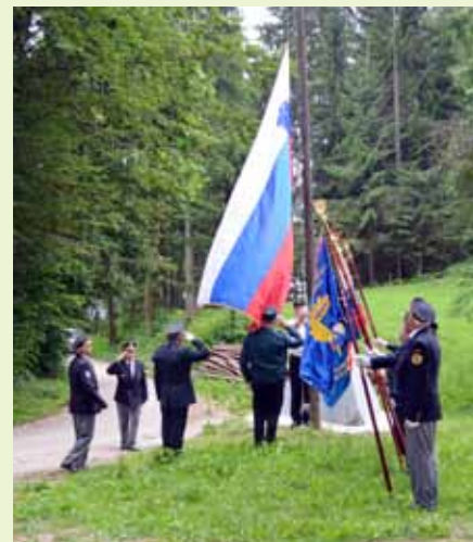
Izobešanje državne zastave