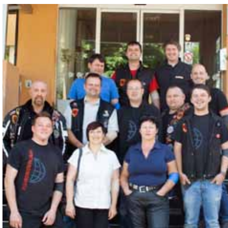
Skupinska slika po malici

Prvotni plan letošnje strokovne vikend ekscurzije je bil obisk Banjaluke, ki pa smo ga morali zaradi vremenskih razmer oziroma posledic le teh spremeniti. Tako smo v zadnjem tednu iskali novo lokacijo in jo našli na Krasu. Nastanitev so nam omogočili prijatelji iz moto kluba Rihemberk (Preserje nad Branikom) v svojih klubskih prostorih, za katere moramo priznati, da so izjemni. Po besedah njihovega predsednika ob dogovarjanju za naš obisk so nam odstopili svojo dušo, to smo rokovnjači znali ceniti in ravnali z njihovim prostorom kot s svojim lastnim. Na voljo nam je bila kuhinja, prostor za spanje, žur prostor z ozvočenjem,