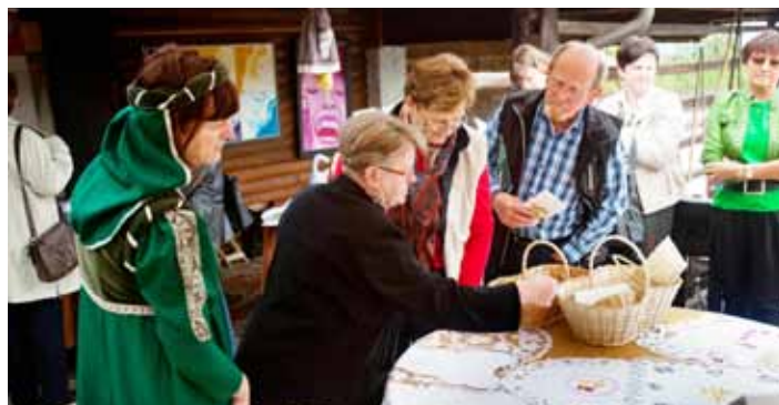
Pod GEOSOM zbrani rokodelci, ki so pristopili k Mreži rokodelcev Srca Slovenije, so si z zanimanjem ogledali tudi izdelke domače in umetnostne obrti.