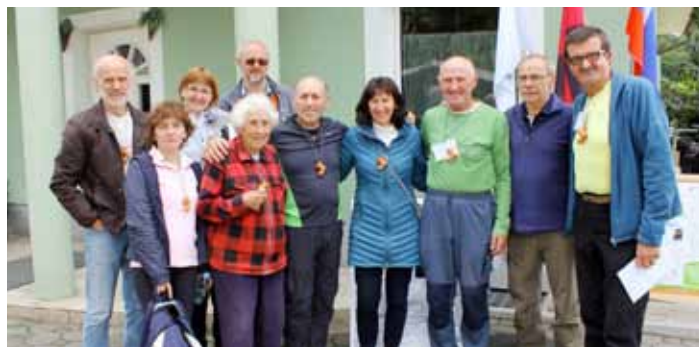
Zakonca Štrefelj s pohodniki in organizatorji

Pohodnikom so se tradicionalno pridružili tudi gorski reševalci iz GRS Postaja Ljubljana in organizatorjem tako prihranili skrbi glede varnosti pohodnikov na poti. Med tem časom so v Krašnji na cilju postavili šotore,