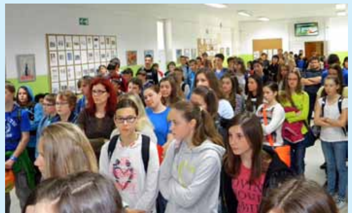
Tekmovalci in njihovi mentorji