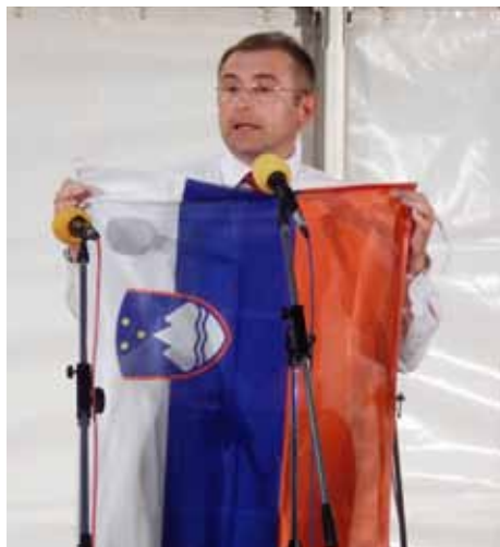
Župan med govorom o pomenu naše zastave