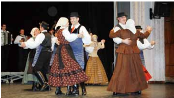
Nastop na območnem srečanju v Domžalah, 8. marca 2014