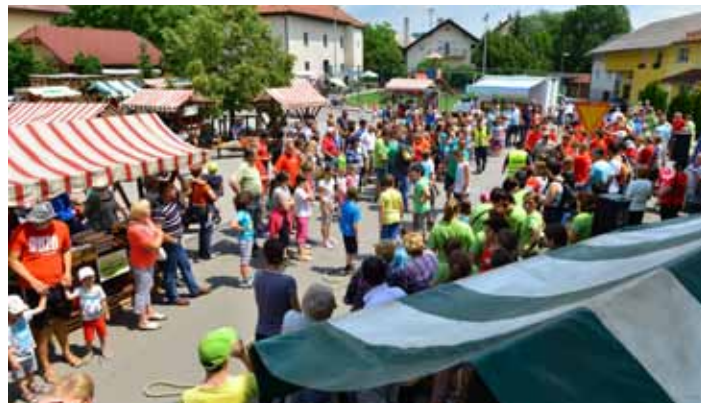
Sejem bil je živ

Hvala vsem obiskovalcem Vidovega večera in sejma, da ste obema dnevnoma vdihnili veselje in srčnost. In nenazadnje zahvala vsem sponzorjem