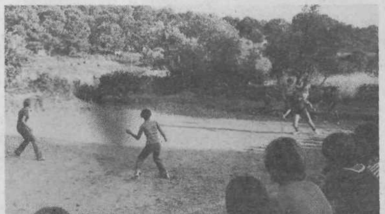
Tekma med dvema ognjema je bila zanimiva, zmagale so tabornice, prav gotovo tudi zaradi spodbujanja navdušenih gledalcev.