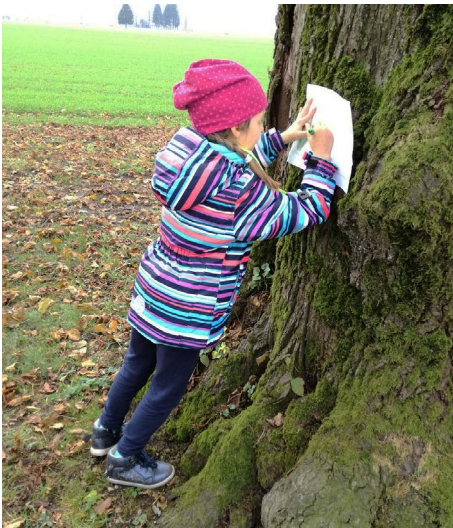
Reševanje učnega lista o opazovanem drevesu

Učni predmet spoznavanje okolja, ki se pojavi v prvem triletju devetletne osnovne šole, je vsekakor eden izmed tistih, v katerem najdemo značilnosti različnih predmetov. V svojem obsegu namreč zajema družboslovne, naravoslovne in tehnične vsebine, ki učencem omogočajo spoznavanje in razumevanje tako