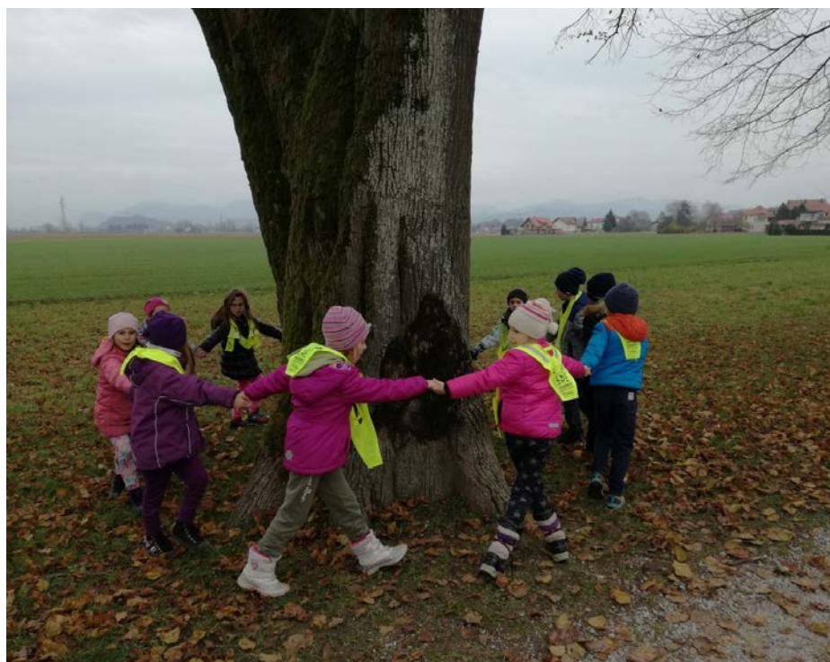
Ples in petje ob drevesu

Izvedli smo tudi naravoslovni dan na temo drevesa. Odšli smo v bližnji drevored in si drevesa pobližje ogledali. Okoli njih smo tudi zaplesali in