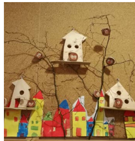
Skrb za ptice v mestu (ptičje hišice s sovicami)