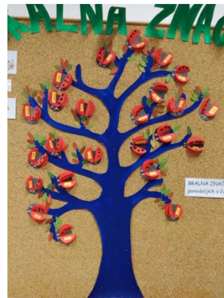
Bralno drevo, ki že zeleni (6 listkov na veji pomeni, da je učenec že opravil bralno značko).