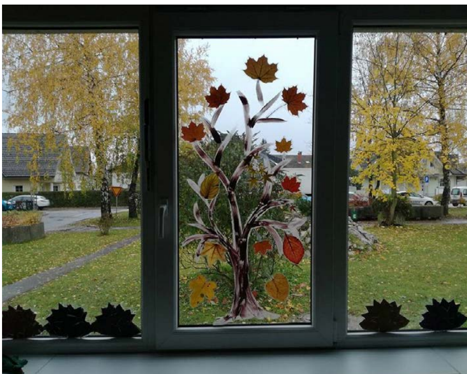
Jesenski pogled skozi okno