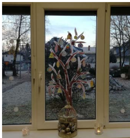
Božično drevo (drevo, okrašeno z božičnimi okraski)

naravnega kot kulturnega okolja. Menim, da bi znotraj omenjenih vsebin lahko našli dele pravzaprav vseh učnih predmetov, ki se poučujejo na osnovni šoli, kar pa pomeni tudi možnost medpredmetnega povezovanja. Mladi nadobudneži se seznanjajo s pojmom drevo, različnimi drevesnimi vrstami, z naravnimi materiali, z živalmi, s skrbjo za živali in njihovimi bivališči (življenjskimi okolji) ... Naravne materiale tudi preštevajo ter jih ločujejo po različnih skupinah. S sodelovanjem na raznih likovnih natečajih pa lahko še bolj izrazijo tudi svojo umetniško stran.