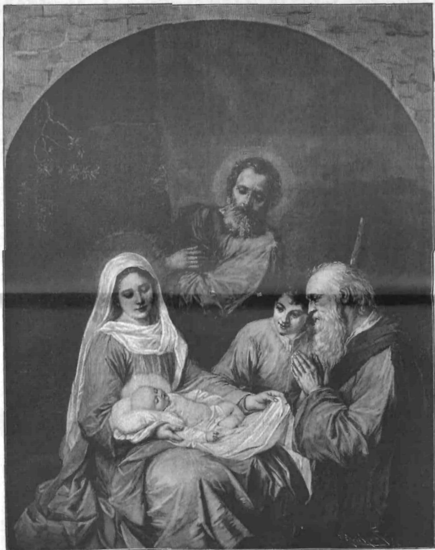
▷ Rojstvo Gospodovo ◁