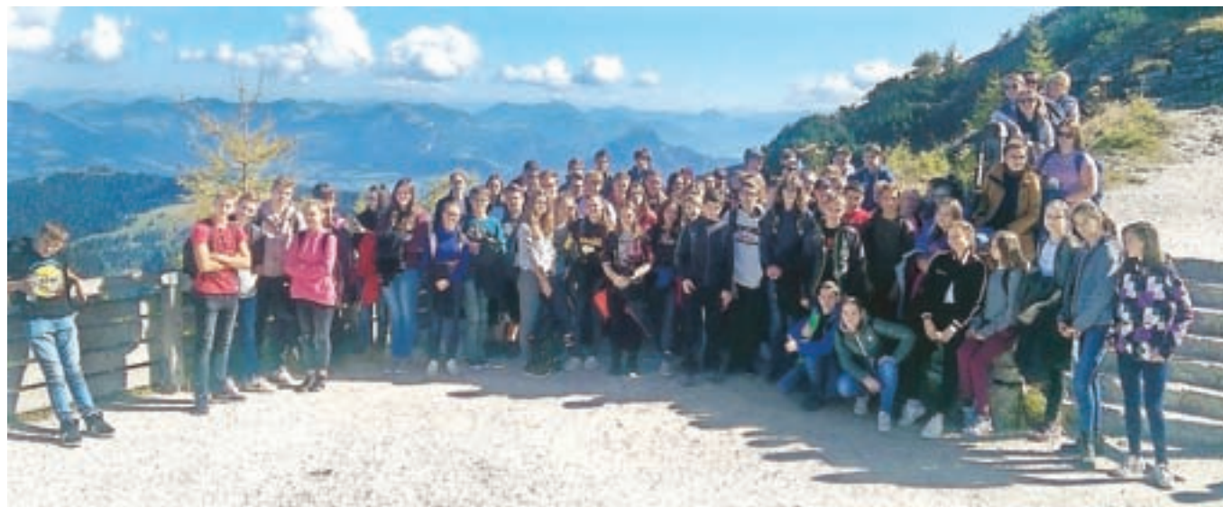
Skupinska fotografija na Orlovem gnezdu

orodja, ki so pri tem potrebna. Po dobrih dveh urah smo se vrnili na površje. Odpeljali smo se še proti naši zadnji postojanki, tj. Kraljevo jezero – der Königssee. Najprej smo se vsi skupaj sprehodili do jezera, kjer smo zvedeli nekaj stvari o tem kraju ter dobili še zadnje napotke. Sami smo se odpravili po vasici in se počasi vrnili proti avtobusu, od koder smo se odpeljali nazaj domov, kamor smo prispeli okoli desete ure zvečer.