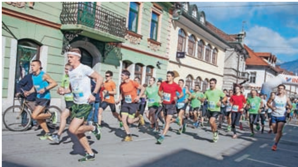
Trasa Veronikinega teka je letos prvič potekala po spremenjeni, desetkilometrski progi.

Tekaško dopoldne v središču mesta pa so sklenili najmlajši, ki so se skupaj s starši podali na tek Ciciban teče.