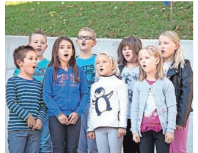
V kulturnem programu so nastopili tudi učenci podružnične šole.