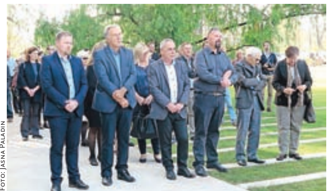
Slovesnega odprtja so se udeležili številni gostje.