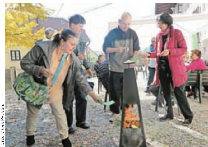
Predsodki o duševnem zdravju so šli takole na »grmado«.

Za vse obiskovalce centra so ta dan pripravili tudi košarico dobrih misli in napotkov, kaj lahko za svoje duševno zdravje in dobro počutje naredimo sami, druženje pa sklenili s skupino Alternativa band društva Altra iz Ljubljane.