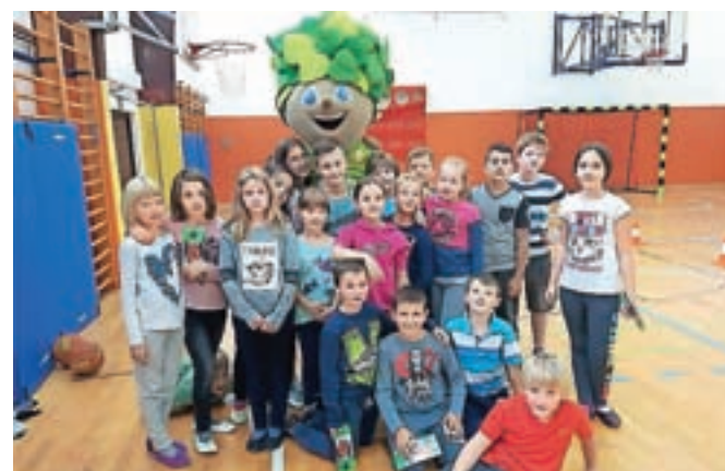
Spoznavali smo tudi Košarkarski klub Kamnik.