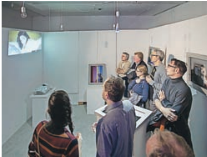
Štirje člani kluba so ali pa še bodo razstavljali v sklopu programa Paviljona Petra Raucha v Muzeju sodobne umetnosti Metelkova.