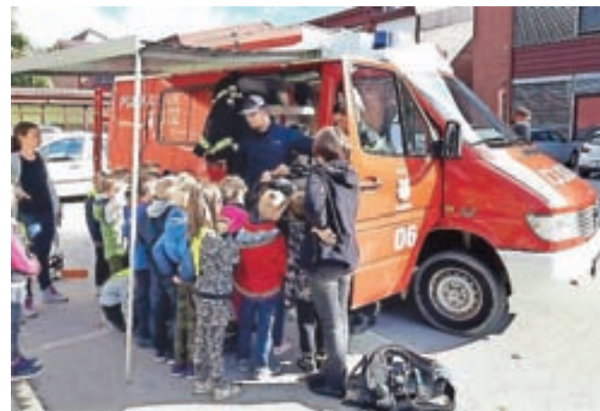
Gasilci PGD Kamnik

Razšli smo se bogatejši za lepo izkušnjo. Morda pa se kmalu zopet srečamo!