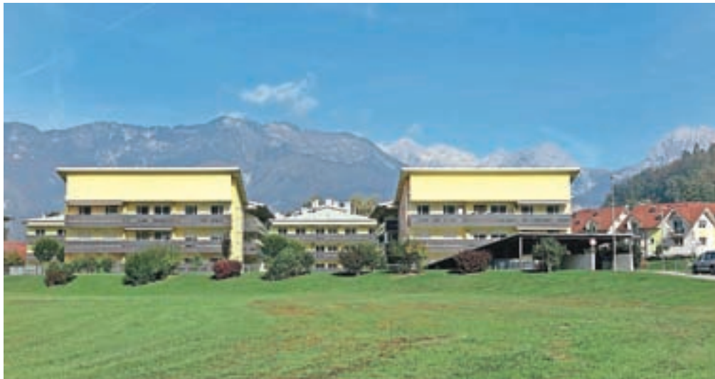
Soseska oskrbovanih stanovanj Pod skalco ostaja napol prazna.

Na to, da kupca za celoten paket nepremičnin v tej so-