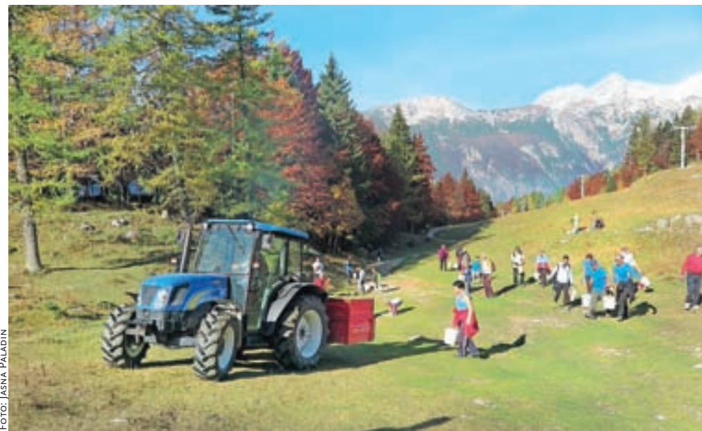
Okoli štirideset ljubiteljev Velike planine je takole pobiralo kamenje po smučišču.

Ali je udeležence akcije privabila obljubljen nagrada v obliki tople malice in čaja ter brezplačne dnevne smučarske vozovnice ali le čudovito vreme in dobra družba, sploh ni pomembno. Čakalo jih je veliko dela, saj so z vedri v rokah pridno »prečesali« smučišče od zgornje postaje nihalke do Zelenega roba in si nagrado več kot zaslužili. »Udeleženci so pobrali približno dvajset ton kamenja, in sicer po trasi smučišča, saj si želimo, da bi ga pozimi tako lažje uredili. Akcija je bila zelo uspešna, zaradi česar smo se odločili, da jo bomo ponavljali vsako leto. Vzdušje je bilo namreč res dobro. Ljudje so nam osebno izrazili čestitke za naš trud v zadnjih letih, v katerih smo družbo Velika planina uspeli pripeljati do pozitivnih števil, in nam zaželeli, da nam bo zima naklonjena s snegom. Poleg navedenih udeležencev akcije so se nam za kratek čas