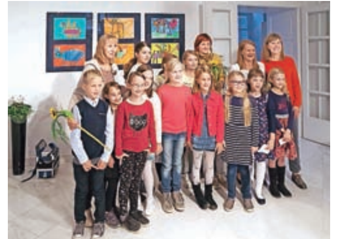
Sodelujoči na razstavi Povabimo sonce v šolo v galeriji Šola idej

V Šoli idej na Šutni svoja likovna dela razstavljajo učenci Osnovne šole Frana Albrehta.