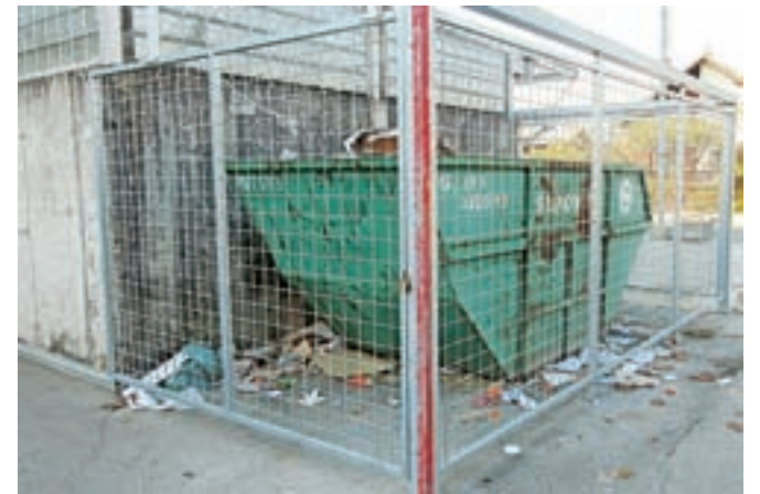
Okolica zabojnikov pri Mercatorjevem centru je vse prej kot čista in urejena.

Za pojasnila smo zaprosili tudi pristojne pri Mercatorju. »Z omenjeno problematiko se ukvarjamo že nekaj časa in navkljub nekaterim tehničnim izboljšavam (izdelava žične ograde, dobava odprtega zabojnika, zaklepanje lokacije hrambe) in s tem povezanimi stroški se