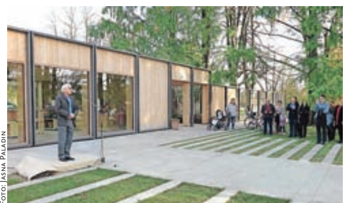
Slavnostni govornik, minister za kulturo Anton Peršak