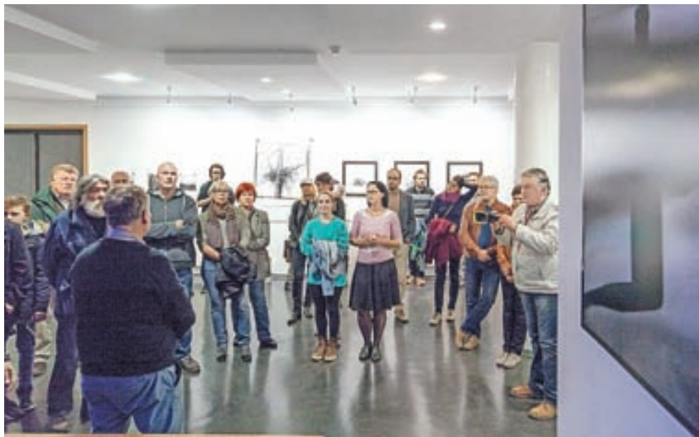
Prejšnji teden so v Foto klubu Kamnik odprli razstavo del, narejenih po analognem fotografskem postopku.