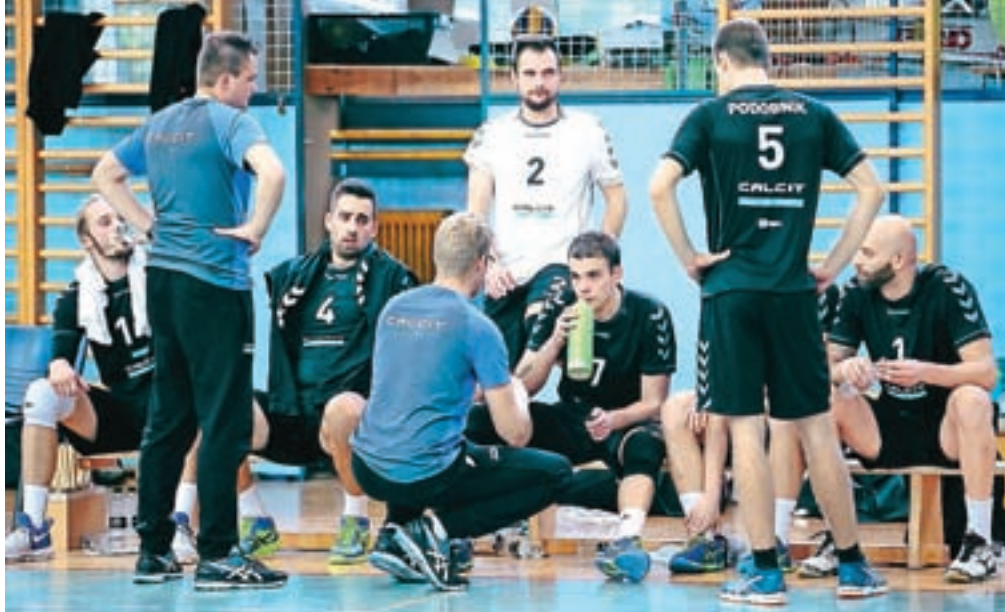
Varovanci Gašperja Ribiča so srednjeevropsko ligo začeli s tremi zmagami.

O moči kamniške ekipe smo se lahko prepričali že na uvodu sezone, ko so na prvem turnirju srednjeevropske lige v avstrijskem Zwettlu vse tri ekipe premagali brez izgubljenega niza. Na prvi tekmi so bili boljši od Mladosti iz Kaštele, nato pa so ugnali še Košice iz Slovaške in za konec domači Waldviertel. Tudi domače