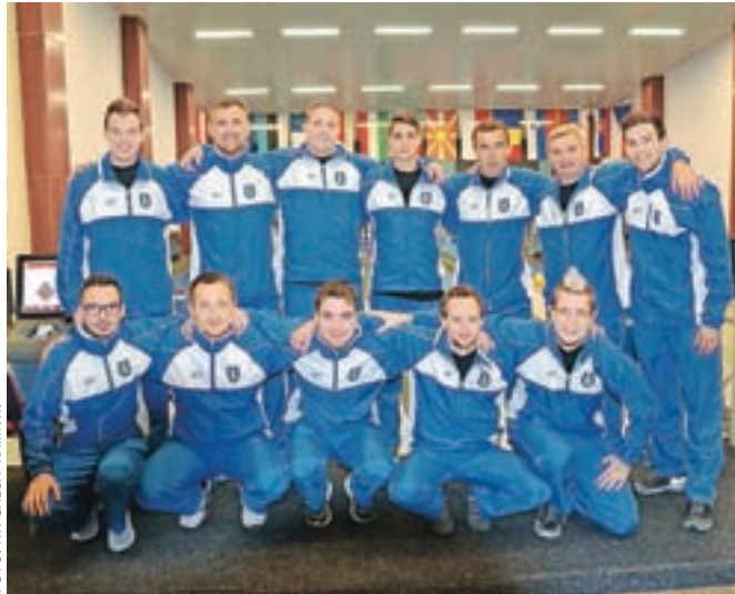
Prva moška ekipa Kegljaškega kluba Calcit Kamnik

Kegljači Calcita so na NBC evropskem pokalu državnih prvakov zasedli osmo mesto in odlično zastopali barve Kamnika in Slovenije.