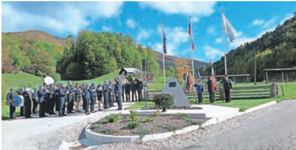
Veterani so že lani sklenili, da bodo slovesnost ob prenovljenem spomeniku v Golich pripravili vsako leto prvo soboto v oktobru.