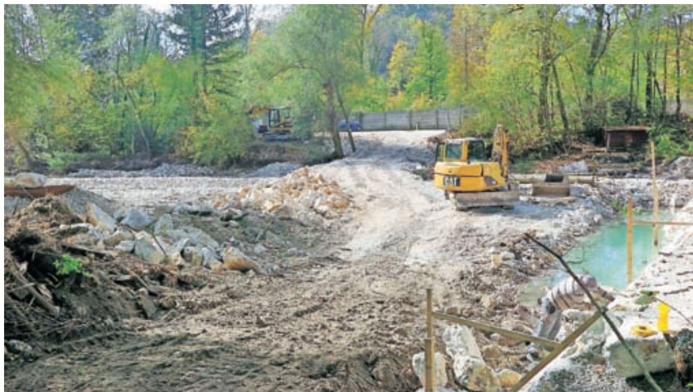
Sanacija struge Kamniške Bistrice na odseku ob nekdanji smodnišnici bo zaščitila predvsem cesto in vodovod. / FOTO: JASNA PALADIN

Državni koncesionar na področju urejanja voda Hidrotehnik je v zadnjem času precej aktiven tudi na vodotokih po občini Kamnik. Z ukrepi iz programa za sanacijo škode iz lanskega avgusta bodo precej izboljšali poplavno varnost na Kamniškem, za to pa namenili skoraj milijon evrov.