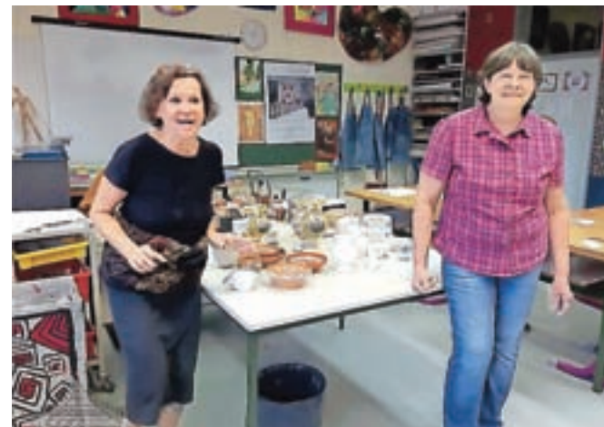
KUD Hiša keramike, zakaj pa ne majolka