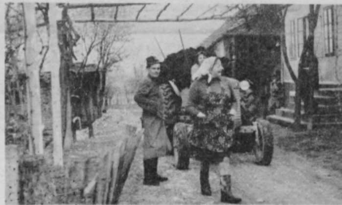
Vse več kmetij vodijo žene