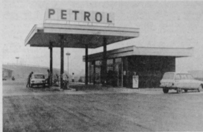
Bencinska črpalka v Podlehniku

Že mnogo je bilo prelitega tiskarskega črnila, ko smo pisali o Halozah in nerazvitosti teh krajev, kjer predvsem manjka industrija. Posledica tega je, da Haložani odhajajo na delo v oddaljene kraje, kjer imajo razvito industrijo, mnogi tudi v tujino.