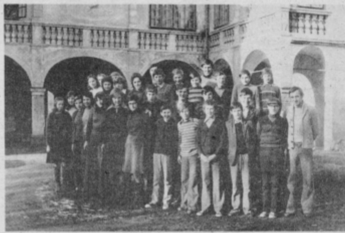
Zdajšnja generacija učencev v kmetijstvu