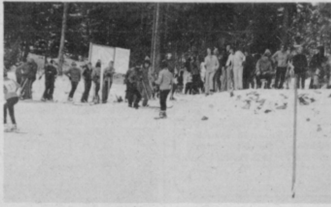
Tako je zadnje dni na bistriškem Pohorju.