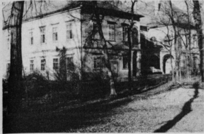
Poslopje turniškega gradu, kjer se mladi kmetje pripravljajo za svoj bodoči poklic umnega in naprednega kmetijskega proizvajalca.

Zato je tudi nerazumljivo, da ob problemu obstoja živinorejske kmetijske šole Turnišče, ki se pojavlja vsako leto znova, stojimo ob strani. Šola gostuje v gradu Turnišče, v zgradbi, ki je stara čez 500