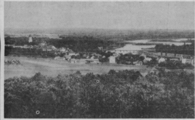
Pogled na Ormož pred 50. leti

Ko bomo 20. februarja razstavo uradno zaprli, bo do konca marca posameznim skupinam ogled razstave s strokovnim vodstvom še možen, seveda po predhodnem dogovoru z upravo Zgodovinskega arhiva v Ptujju. Za obiskovalce pa bo v tem času razstava odprta vsako nedeljo od 9. do 12. ure! P. KLASINC