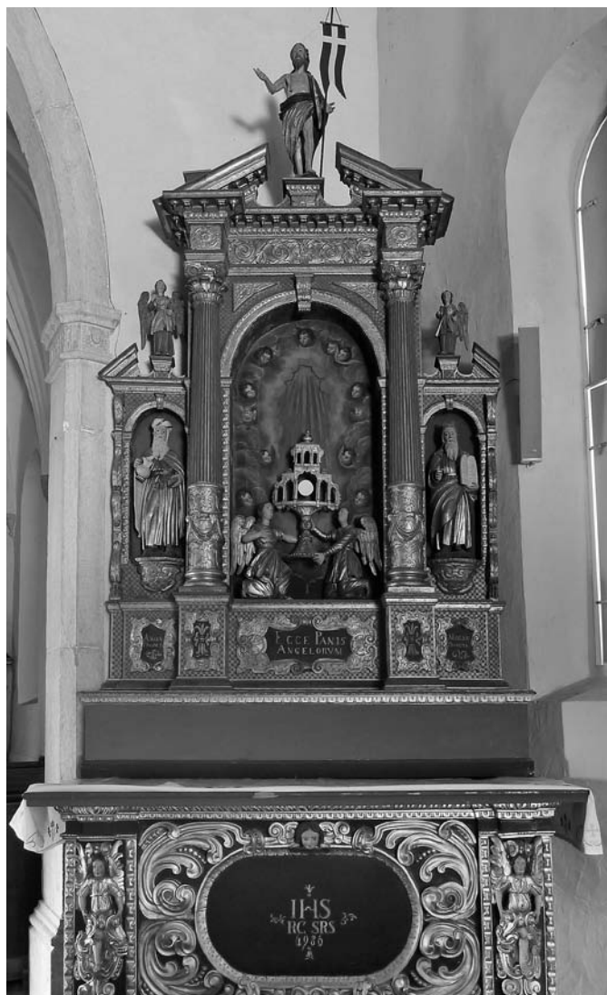
Oltar bratovščine sv. Rešnjega telesa, 1642, Podbrje-Podnanos, p. c. sv. Kozma in Damijana

391. Štepanja vas, p. c. sv. Štefana (božji grob), bratovščina božjega groba : članov (skupno) 233; Polje, p. c. Device Marije, bratovščina sv. Barbare ; op.: obe bratovščini vzdržujejo iz cerkvene blagajne, njuni prihodki so pomešani s cerkvenimi.