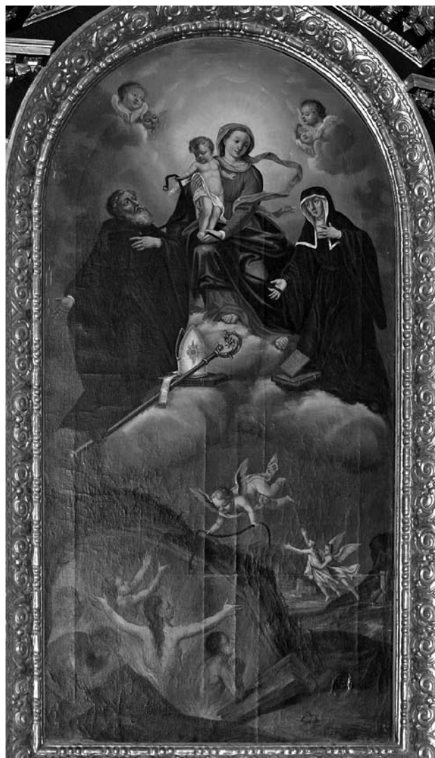
Oltarna slika bratovščine pasu sv. Monike, Nova Štifta pri Ribnici, p. c. Marijinega vnebovzetja