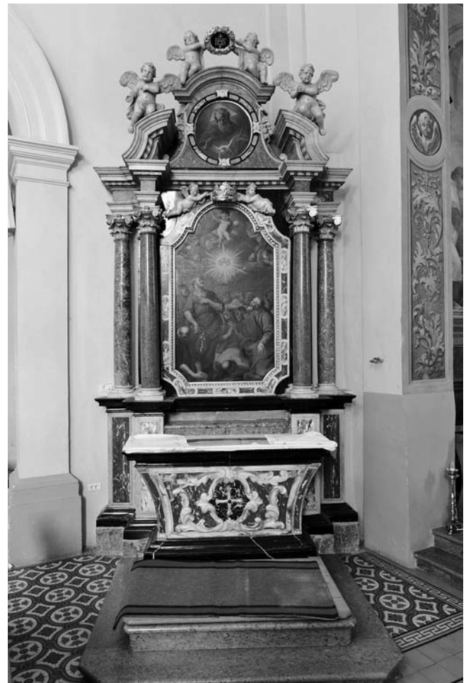
Oltar bratovščine Imena Jezusovega, 1722, Vipava, ž. c. sv. Štefana