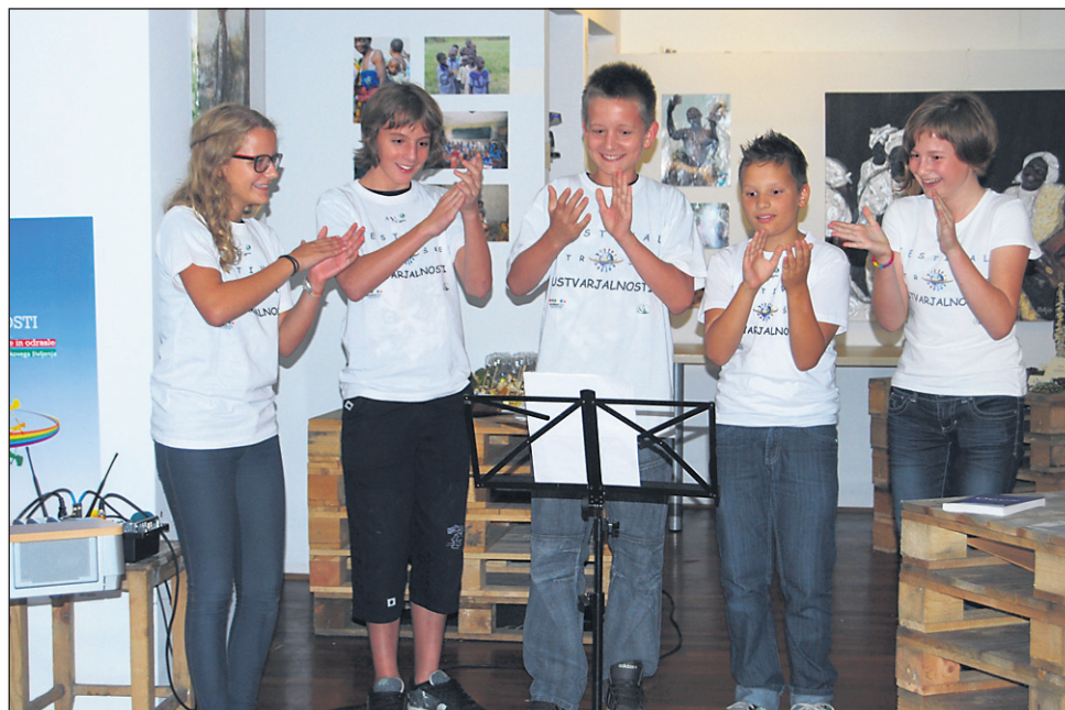
Mladi glasbeniki Dream drum team