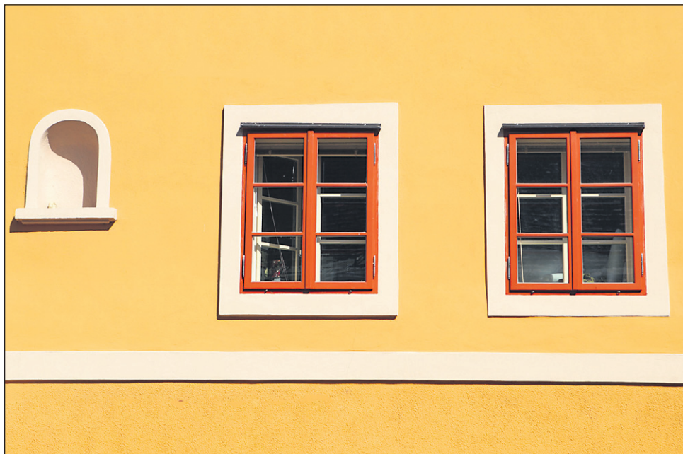
Lesena okna so najboljša izbira.

okna, je veliko bolj prijetna, prav tako je lepši tudi videz. Ob odstranitvi takšnega okna lahko les predelamo v lesne sekance, pelete, skratka za kurjavo, medtem ko je uporaba aluminija veliko težja. Ko smo pri okoljskih problemih, pozabljamo, da les nima izpusta CO 2 , les ga skozi svojo življenjsko dobo akumulira in skladišči; skladišči ga malo več, kot ga odda pri izgorevanju. Kubični meter lesa skladišči dve toni CO 2 , kubični meter aluminija ga v zrak izpusti 26 ton, kubični meter jekla pa 16 ton. Zato je les tudi z okoljskega vidika logična izbira. Pri nas še toliko bolj, saj je Slovenija ena izmed najbolj gozdnatih držav v Evropi, z njimi je pokrita v 60 odstotkih, a žal ne