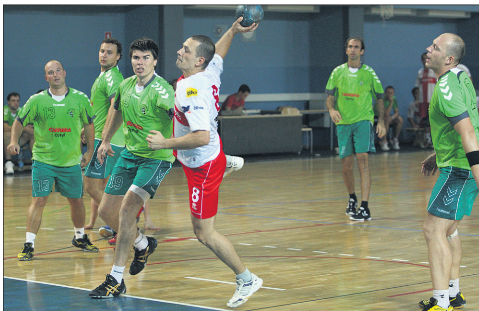
Rokometiški Drave so pretekli teden izgubili srečanje z Veliko Nedeljo CO (na fotografiji), tokrat so klonili še proti Gorišnici.

saj so upravljali čiste situacije za zadetek, prav tako pa so slabo