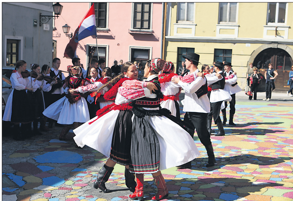
Folkloristi iz Slovenije in tujine so popestrili mestne ulice