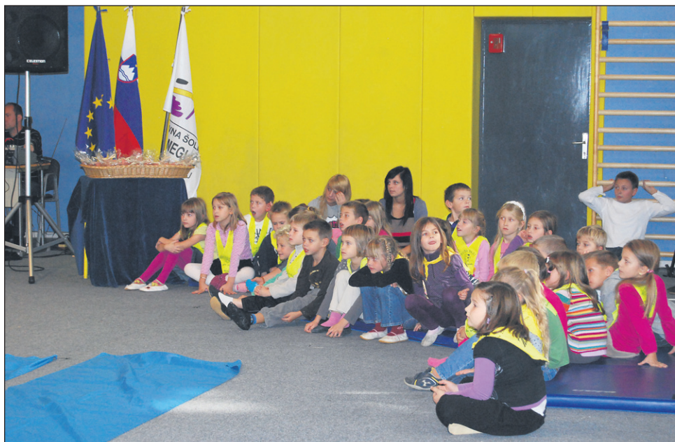
Šole so znova odprle svoja vrata.

Daleč največji vpis med šolami s Ptujkega pa imajo tudi letos na OŠ Ljudski vrt . Skupaj s podružnico Grajena, kjer je 130 otrok, imajo kar 762 šolarjev. Od tega je na matični