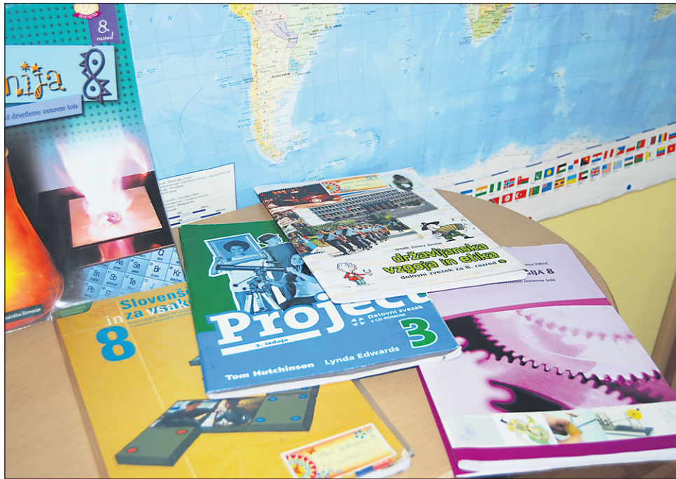
Letos med šolami ni večjih odstopanj v cenah delovnikov.

Na Osnovni šoli Olge Meglič so kompleti delovnih zvezkov v prav vseh razredih cenejši kot lani. V nekaterih razredih bodo starši za delovnike plačali tudi po več