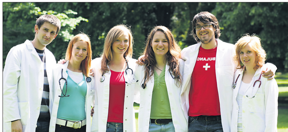
Študentje, ki se bodo odpravili v Malavi

V sredo se bo pooblačilo, dež bo popoldne od zahoda postopno zajel vso državo. Do četrta jutraj bo dež povsod ponehal in čez dan se bo jasnilo. Na Primorskem bo prehodno zapihala zmerna burja. Hladneje bo.